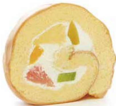
ロールケーキ(フルーツ)