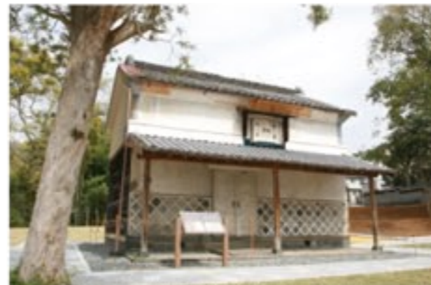
シンボルの宝蔵は今年度中に補修予定

いが、今回整備された園路を下れば、子ども向けの遊具や広場を備えた吉原公園へとアクセスできる。多様で広々としたスペースに生まれ変わった市街地のオアシスで子どもと一緒に遊ぶもよし、歴史を学ぶもよし、新緑の中をのんびりと散歩するもよし。いずれにせよ、ここを初めて訪れる多くの人はきっとこんな感想を抱くだろう。「へえ〜、富士市内にこんな場所があったんだ!」と。