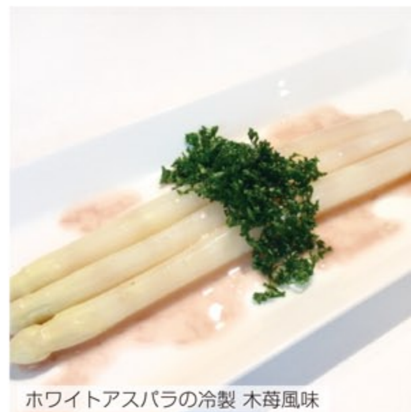
ホワイトアスパラの冷製 木苺風味

L'angela (ランジェラ) 富士市平垣町 6-1 TEL 0545-60-7708 営業時間 10:00〜18:00 日・月曜定休 (5/10(日)は営業) 駐車場・イートインコーナーあり