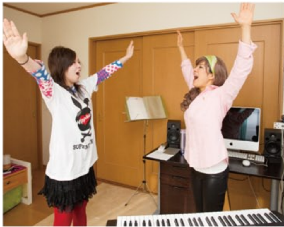
自宅兼スタジオでのレッスンの様子

「特にこれから将来について考える若い人に伝えたいのが、まず何よりも自分を大事にしてほしいということ。自分の考えや思いをきちんと発信すること、偽らないこと。勇気のいることですが、そういう生き方をすることで自分の能力が最大限に発揮できるようになります。また自分を大事にできない人は、他人を大事にすることも守っていくこともできませんよね。これは実際にあった話ですが、ある小学生に将来の夢を聞くと、あえて目標を低く見積もって、実現できそうな回答を出してきたんです。批判されたり笑われたりするのを避けたいという心理があるんだと思います。これでは自分の器を自分で小さくしているようなものです。本当に好きなこと、自身で決めたことなら、周りからいろんなことを言われたり、困難な環境があったとしても、高い目標を持って自分を信じるという強い気持ちを持ってほしいですね。」