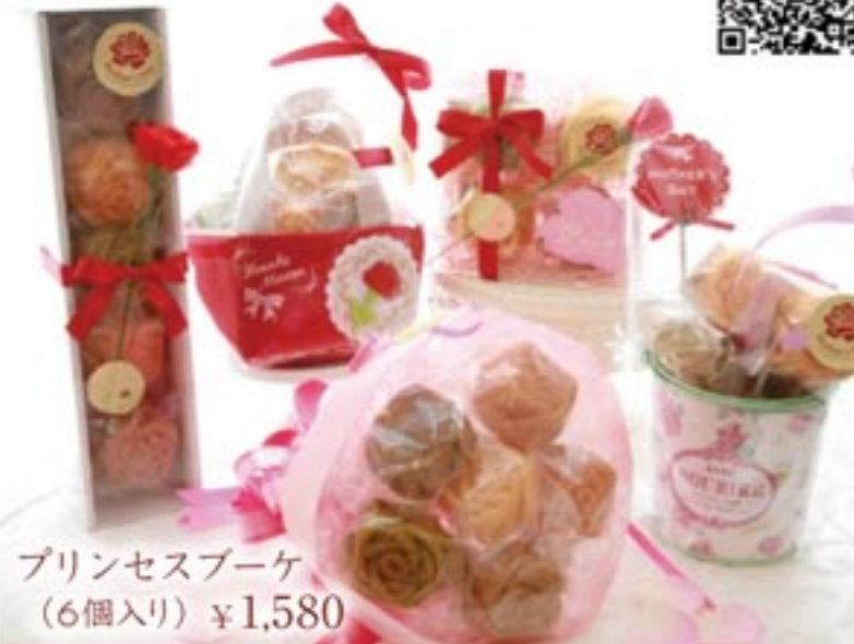
プリンセスブーケ (6個入り) ¥1,580

ランジェラ 検索 http://www.langela.info/ 〜バラのマドレーヌのお店〜 sweet rose L'angela