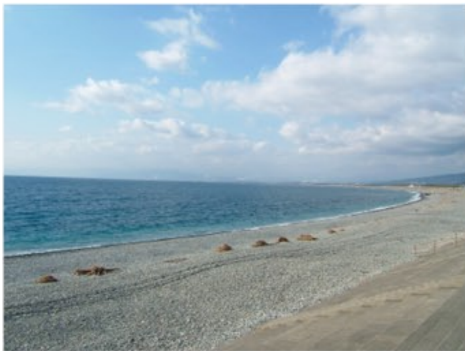
沼津市・千本浜公園

雛が育つ5〜6月に警戒心が強くなり、地面にいる雛に接近するなど挑発すると、後方から足で頭を蹴られかねない。(武)