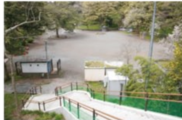
吉原公園へとつながる西側の階段