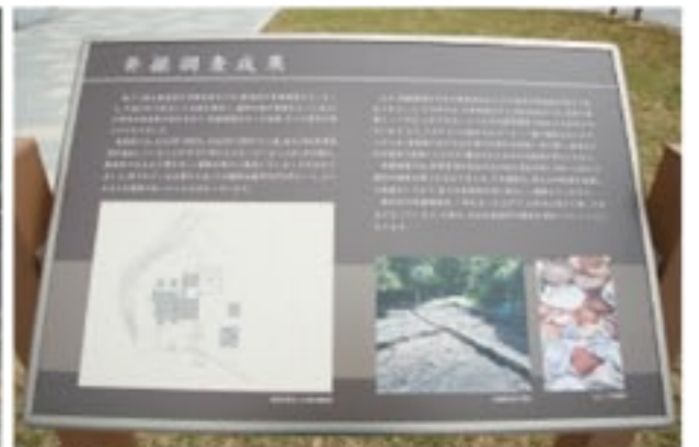
関連資料つきの案内看板で歴史を学べる