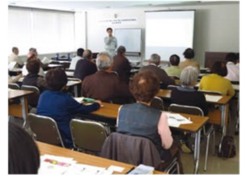
静岡県富士総合庁舎での講演会の様子

と、「枯れる木を1本でも少なくすること」だと思っていますので、手段は選ばせません。(笑)