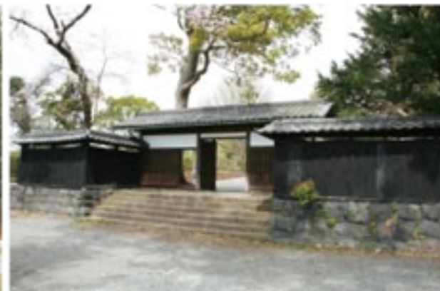
趣ある佇まいの旧六所邸の塀