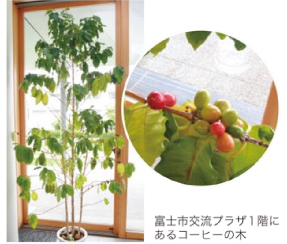
富士市交流プラザ1階にあるコーヒーの木

について考えてみるのもいいかもしれませんね。私はその目に見えない木々の北上を、なんとかこの目で捉えてみたいと思います。