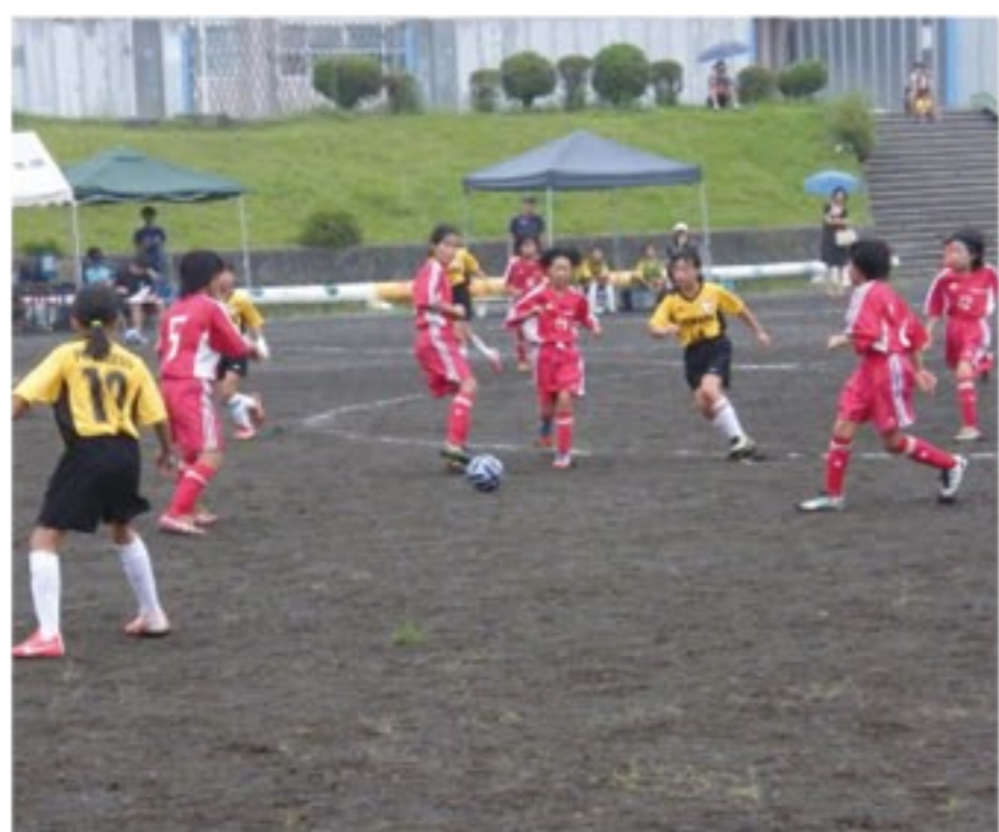
ジュニアチームの試合の様子

「どんなスポーツでも同じだと思いますが、プレーする上で一番楽しいのは、できることが少しずつ増えていくことですね。リフティング、ドリブル、シュート、いろんな技術が身について、それを試合で発揮できれば周りに褒めてもらえま