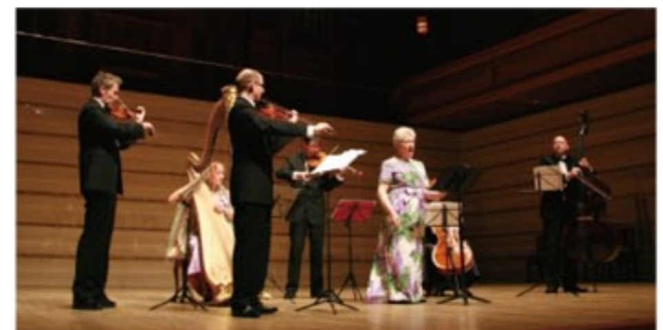
富士でのコンサートの後は静岡 AOI ホールへ (静岡・クラシック音楽を広める会 主催)