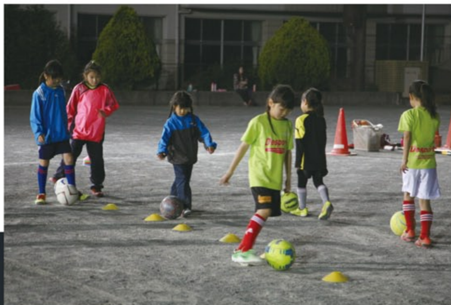
富士市立青葉台小学校での練習風景

う幸せも手に入れてほしいんです。自分の健康にも気を配って、家庭を持ってばきちんと子育てもできる。そういう基本的な生活を送りながら、生涯にわたってサッカーと関わってくれたら、というのが理想です。また、そのためには保護者の皆さんにも同じ意識を持って深く関わってほしいと思っています。技術的な指導だけにとどまらず、世代を超えた人間関係を築くことで、子ども達だけでは対処できない悩みを解決できることもあります。そんな環境の中で、ひとつでも学年が上の子は下の子の面倒を見るということも自然にできるようになってほしいですね。後々人生を振り返った時にサッカーが彩りのひとつになっていたら最高です。まずは楽しく！そして社会に出てからも持ち続けられる心の拠り所として。上手かどうかはその次で、やっぱりそこは中途半端でもいいんです。女子の皆さん、サッカーボールを蹴ってみましょう！」