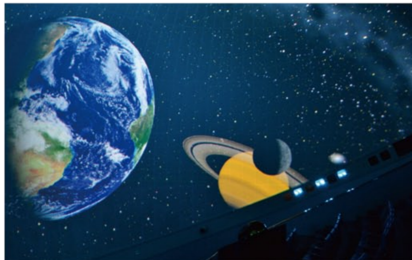
光学式投影機とデジタル映像を駆使した多彩な演出は必見