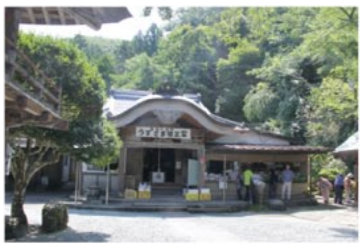
【上】参拝者が絶えない明徳寺の境内 【左】ぼけ封じ観音と老夫婦の像

【読者の皆様へ】 この連載は、筆者が長距離運転が難しくなってきたことなど諸般の事情のため、今回の号で終了いたします。拙文を読んでいたいただいた皆様に深く感謝いたします。