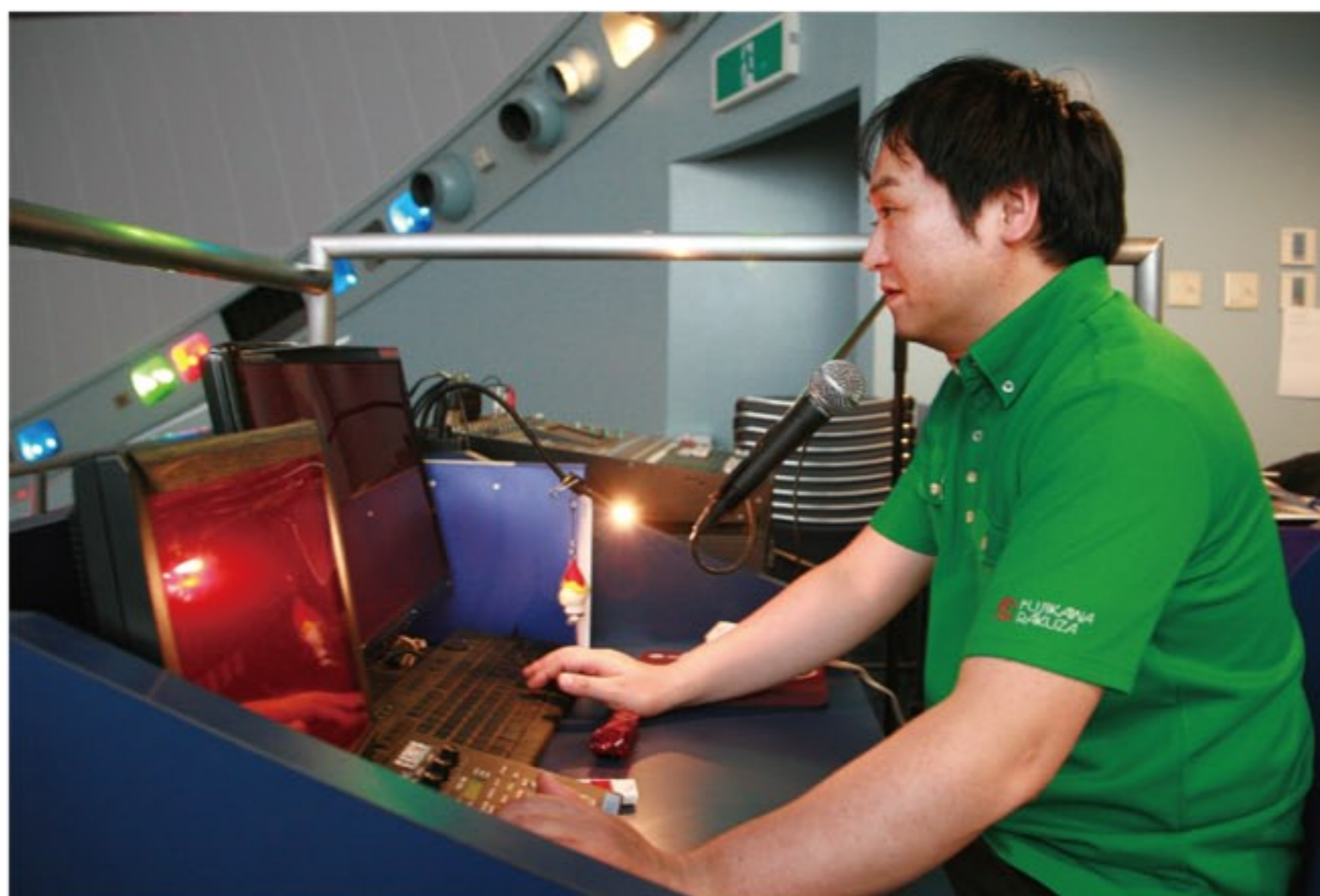
プログラムや操作を行うパソコンはプラネタリウムの司令塔