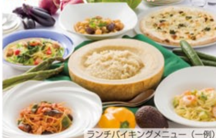
ランチバイキングメニュー (一例)