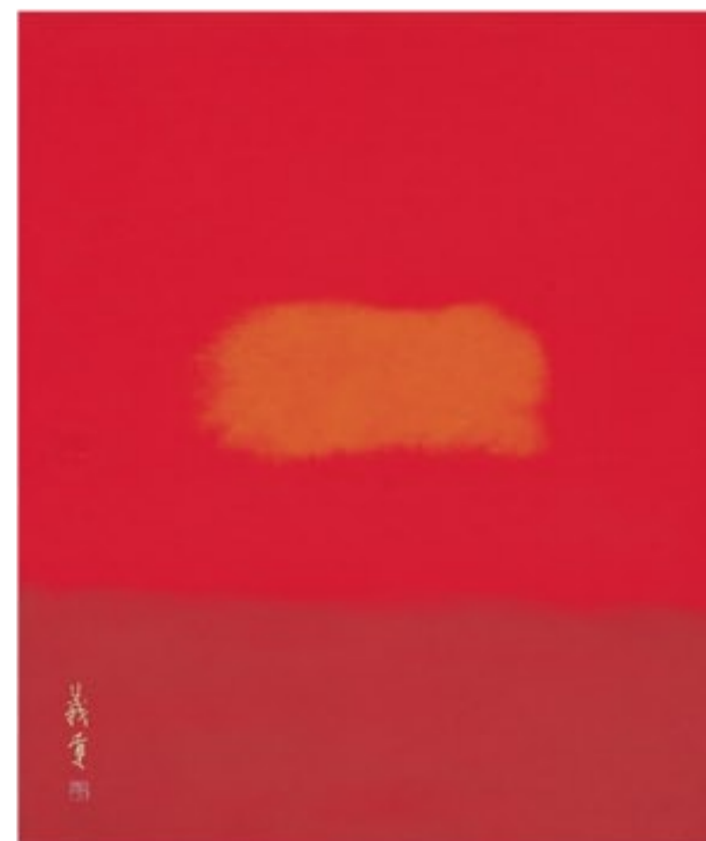
「友」 45.5×37.9cm 2006年