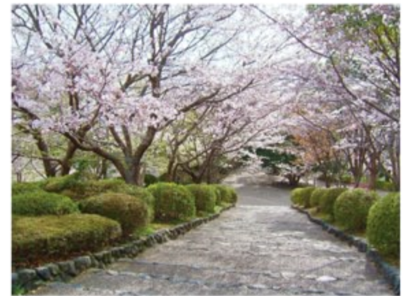
富士市・岩本山公園の桜並木