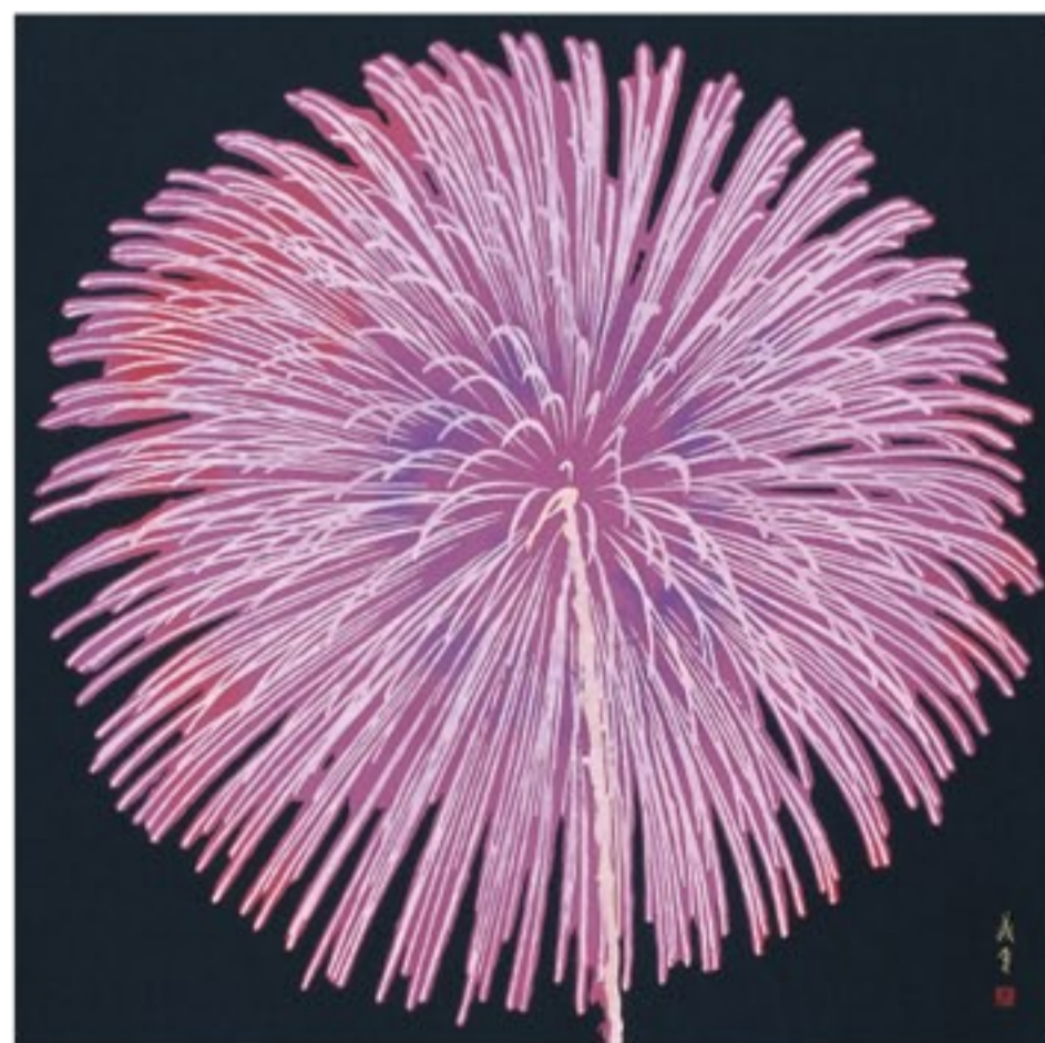
「大輪」 90×90cm 2009年