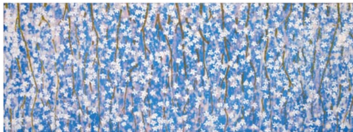
「アマンク・フラワ (SIDARE IV)」 60x160cm 2015年 (第7回個展に出品予定)