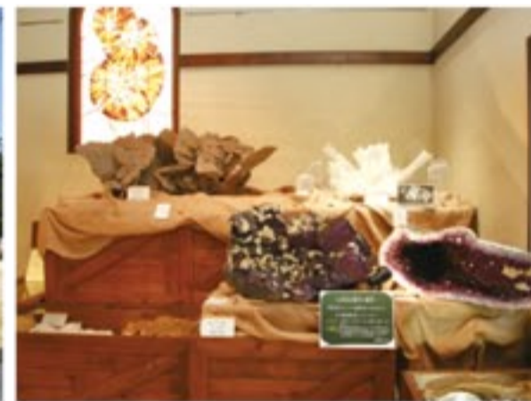
冒険心をくすぐるエントランスホール