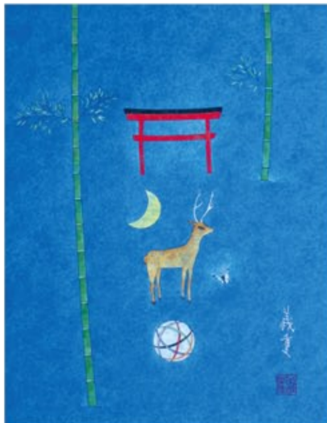
「人民は森の鹿のようだった」 41x32cm 2014年