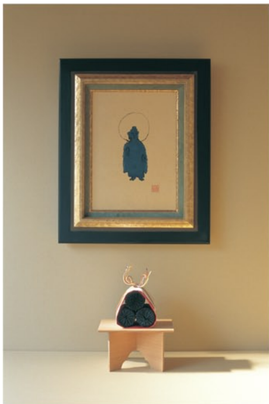
「開」 33×24cm 2010年