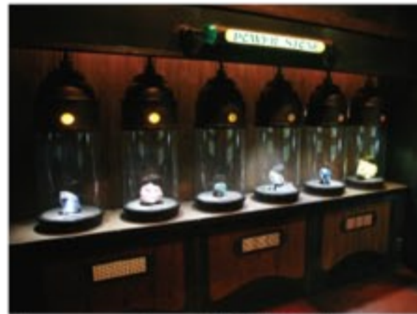
美しいパワーストーンを神秘的に演出