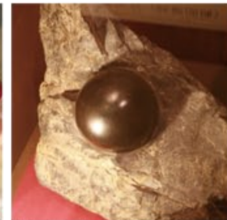
設立のきっかけとなった龍眼石