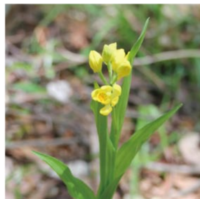
広見公園に咲くキンランの花