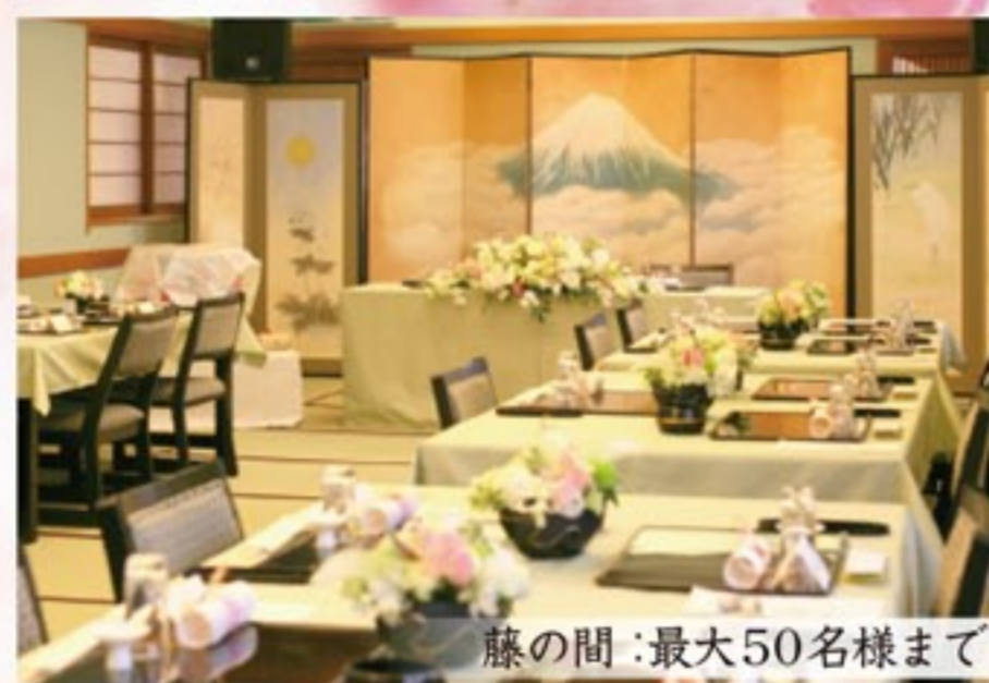
藤の間：最大 50 名様まで