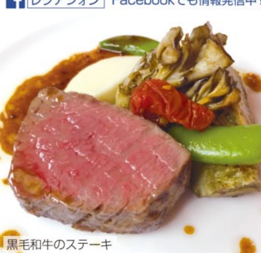
黒毛和牛のステーキ