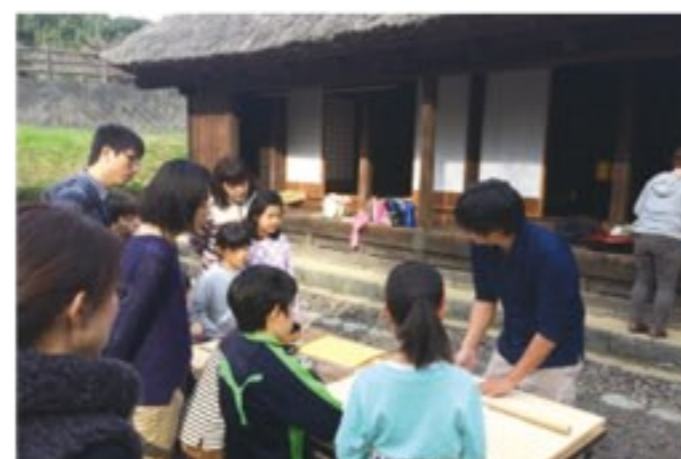
旧稲垣家住宅でのそば打ち体験