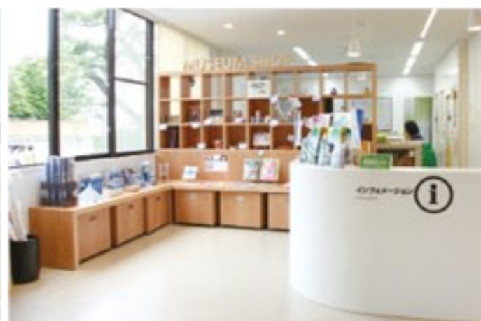
1F受付に併設されたミュージアムショップ