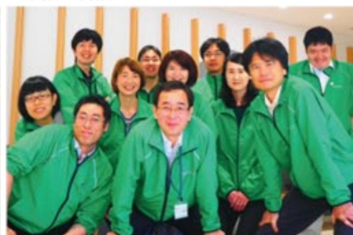
木ノ内館長(中央)とスタッフの皆さん