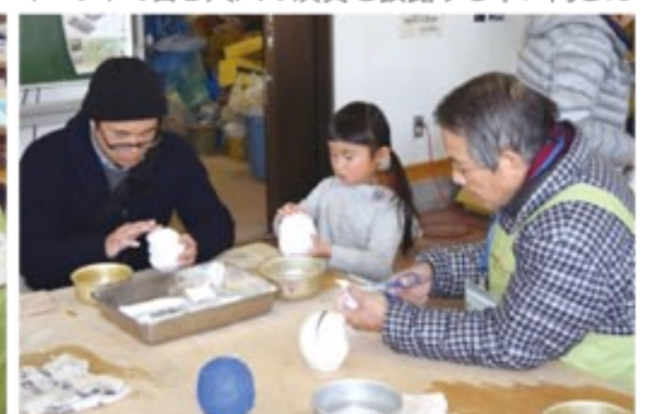
張り子ダルマ作り体験