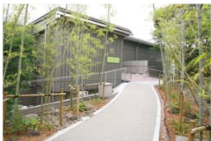
広見公園から直接入館できる2F入口