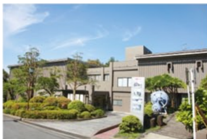
富士山かぐや姫ミュージアム外観