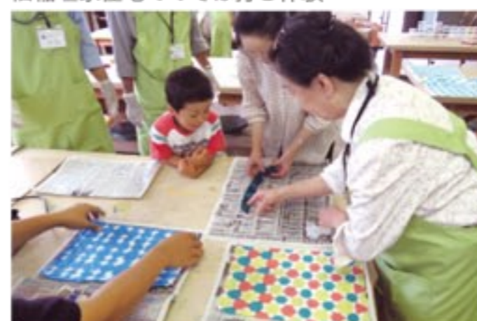
折り染めハンカチ作り体験