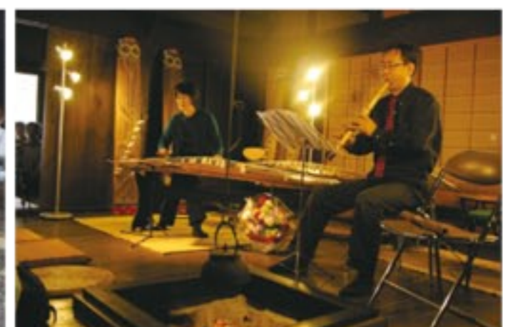
イベントで自ら尺八の演奏を披露する木ノ内さん