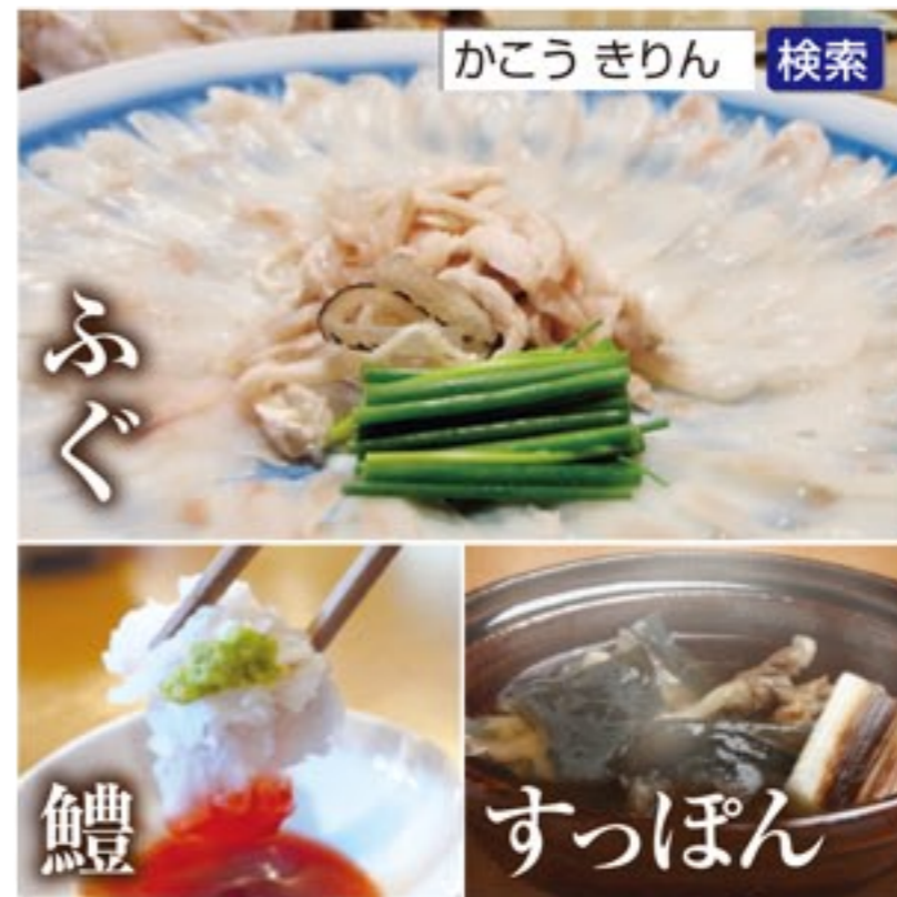
かこうきりん 検索