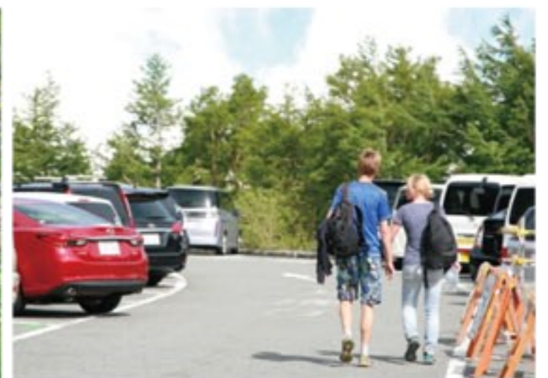
福岡から成田まで千数百キロのドライブは続く