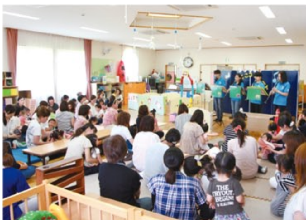
吹奏楽サークル「おぐーんママプラスFUJI」による演奏は人気のプログラム

「大学では教育学部で教員の免許を取得しましたが、卒業後は学校事務という形で就職して、少し離れたところから子どもたちを眺めていました。結婚退職後もしば