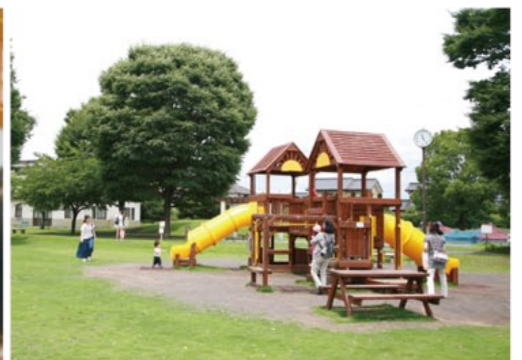
米の宮公園の屋外遊具や広場でも思いきり遊ぶことができる