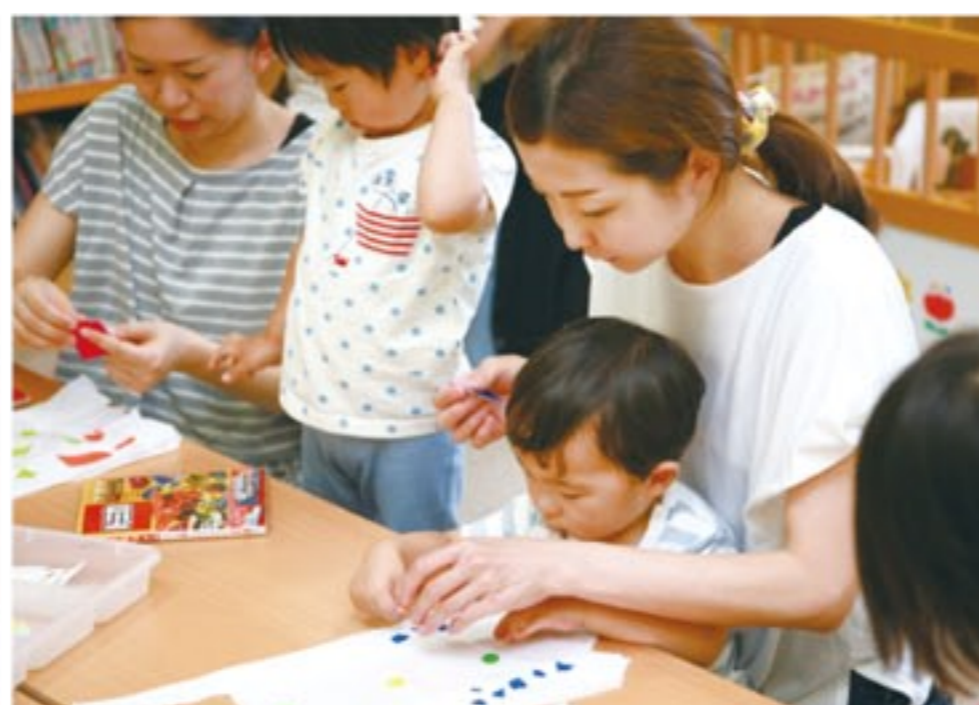
未就園児対象の『にこにこタイム』では親子が触れ合いながら楽しめる