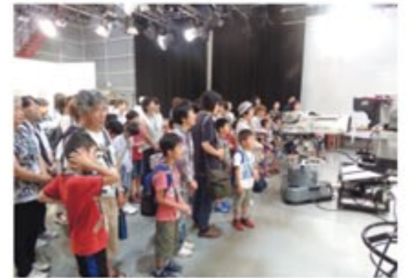
SBSスタジオ見学の様子

日時: 8月9日(火) 8:40 集合 ~ 17:20 解散予定 場所: JR新富士駅 集合・解散 定員: 45名(先着順) 料金: おひとり3,500円(税込) バス代昼食付き ※4歳以上 ※当旅行は「株式会社SBSプロモーション旅行部 SBS ツアーズ」による実施となります