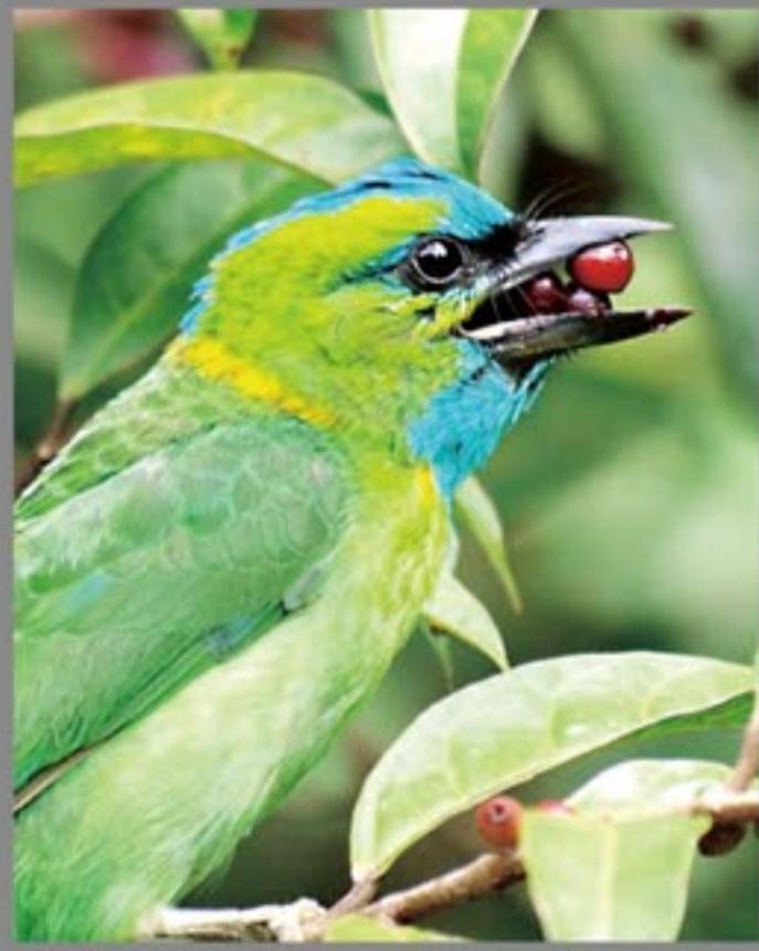
キナバル山の鳥 キエリゴシキドリ

「現地では英語は通じないので5歳を過ぎてインドネシア語を勉強しました。ジャワ語、バリ語など、地域で異なる言語が多様多様ですが、共通語としてインドネシア語があるので結構便利なんです。最近ではガルーダ・インドネシア航空でバリから入ります。バリから目指す島へは飛行機や船を乗り継いでと言う事になります。幸いに今までそんなに危ない目にあつたことはありません。スマトラで崖崩れや洪水で足止め食らつたり、僻地の島で帰りの飛行機が飛ばな