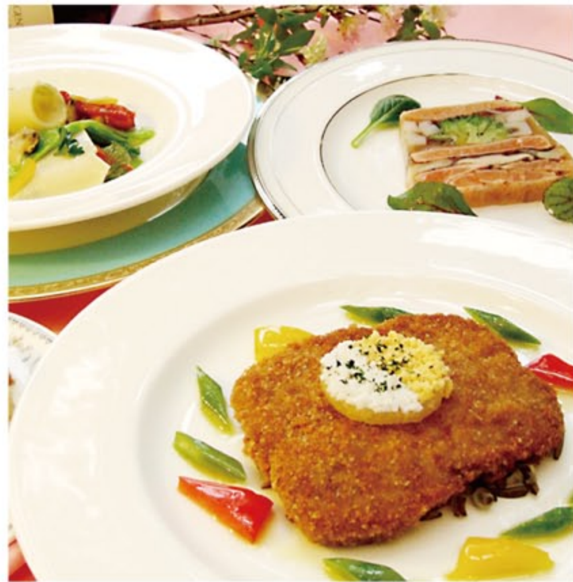
Hotel Grand Fuji ホテルグランド富士 レストラン グラス GRASSE