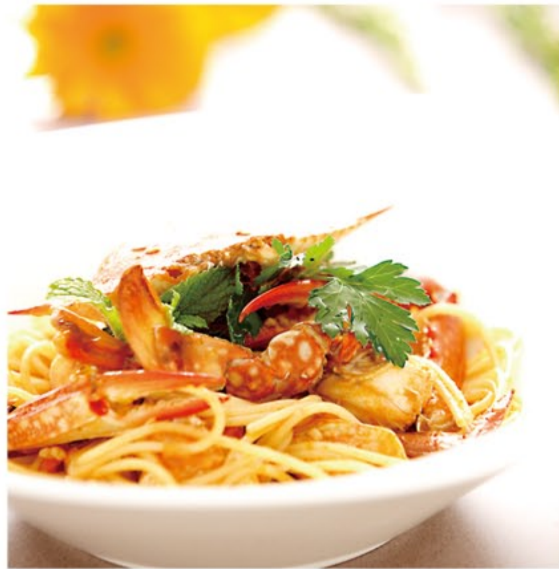
RISTORANTE ITALIANO Campana カンパーナ

春うらら特別企画!! 土日限定企画! (期間) 3/13 ~ 4/25 ランチバイキング デザート食べ放題! ランチバイキング 1,680円~