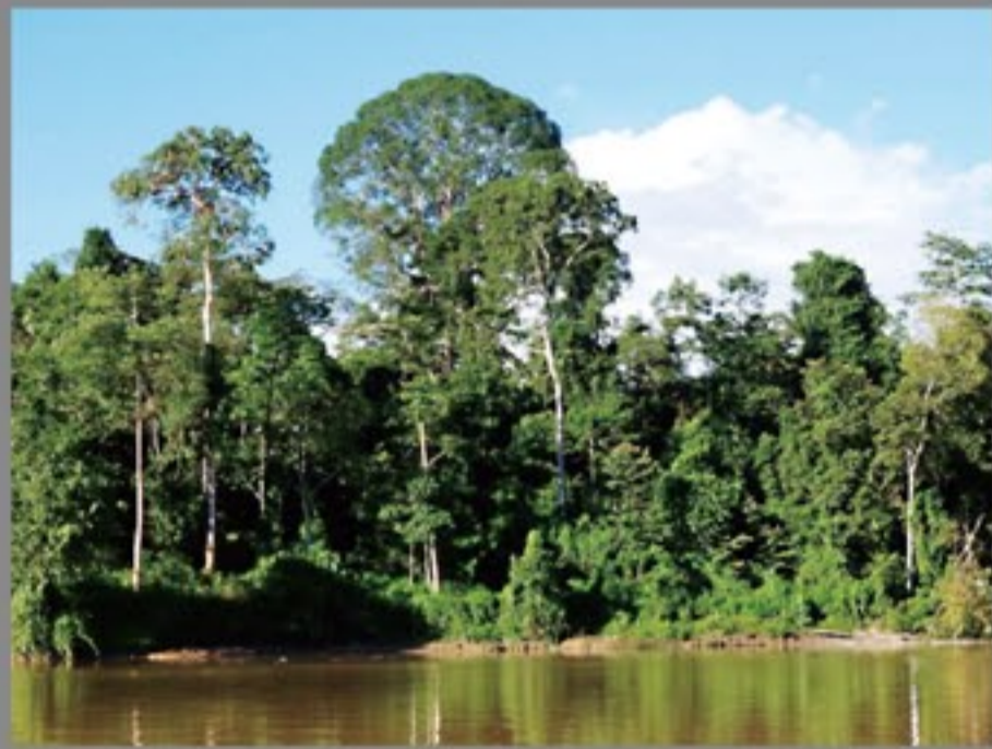
キナバタンガン川と 岸辺の熱帯雨林