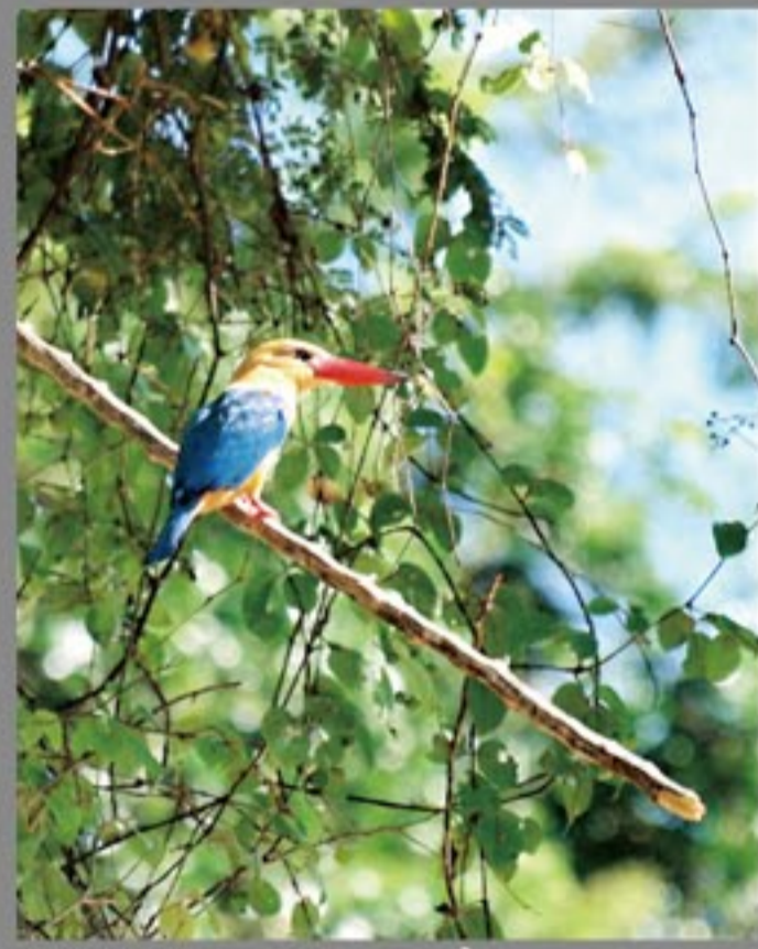
コウハシショウビン ボルネオのキナバタンガン川で 出会ったカワセミの仲間