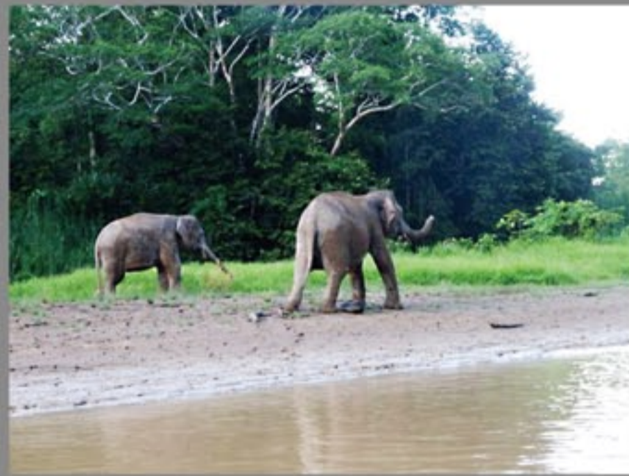
キナバタンガン川岸で ボルネオ象に出会うこともある