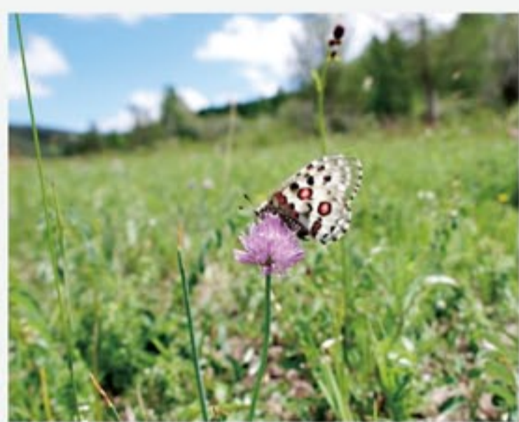
モンゴル高原の妖精 オオアカボシウスバシロチョウ

「蝶の王様と言われるトリバネアゲハは緑色に輝いていました。イギリスの探検家が鉄砲で打ち落としたりという逸話がある大きな蝶で、インドネシアのアンボン島やイリアンジャヤで実際に飛んでいるところを見たときのこととも忘れられません。また、3年前に行つたモンゴルではオオアカボシウスバシロチョウを撮影してきました。アゲハチョウの仲間です。ユーラシアの山地に生息するとても清楚で艶やかな蝶です。」