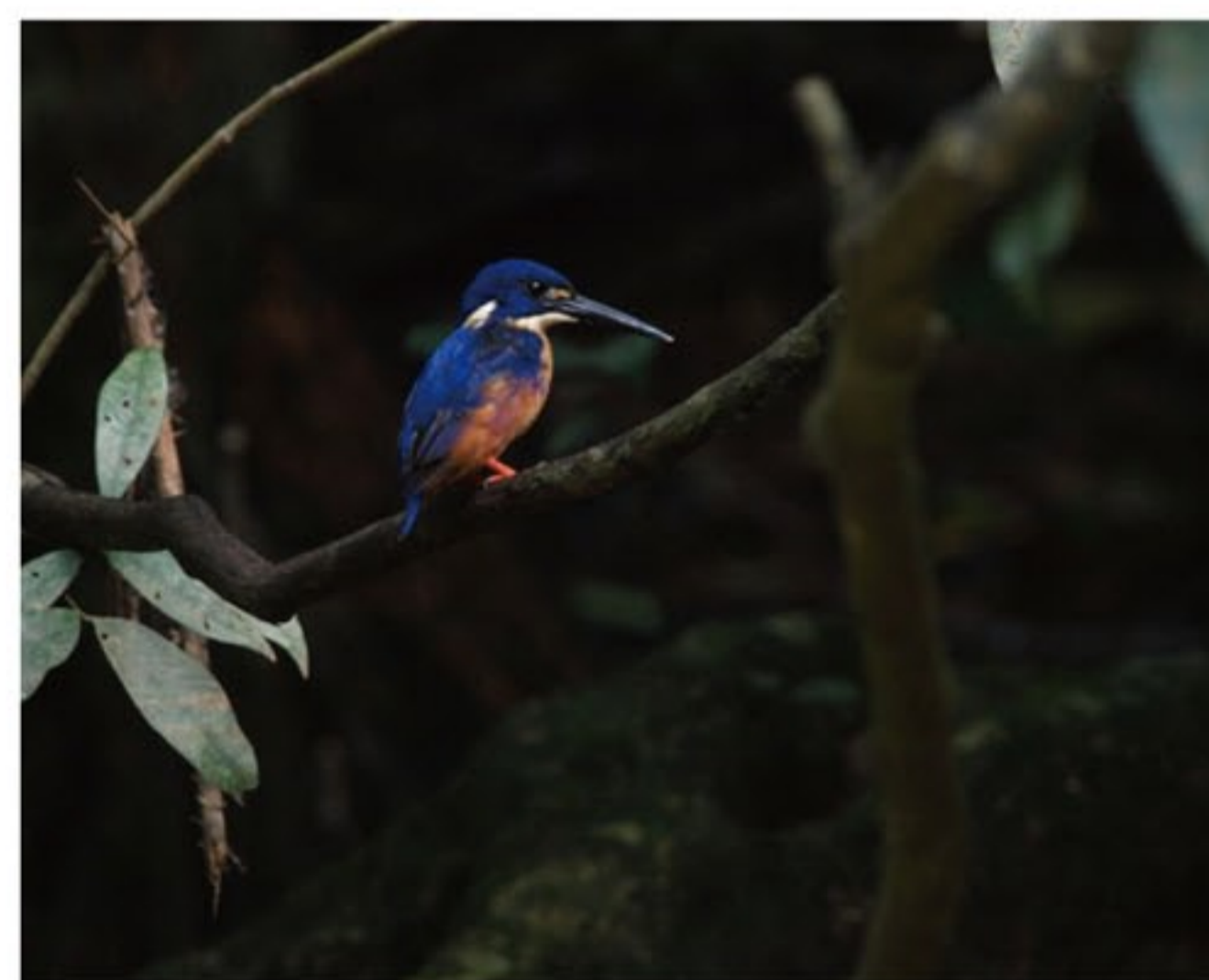
ルリミツユビカワセミ

リパークルーズで更に2種のカワセミの仲間に出会うことが出来ました。日本のカワセミよりもずっと小型のカワセミです。