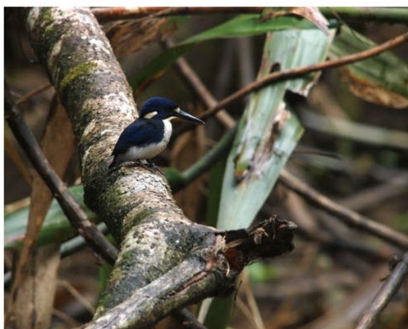
ヒメミツユビカワセミ

リパークルーズで更に2種のカワセミの仲間に出会うことが出来ました。日本のカワセミよりもずっと小型のカワセミです。