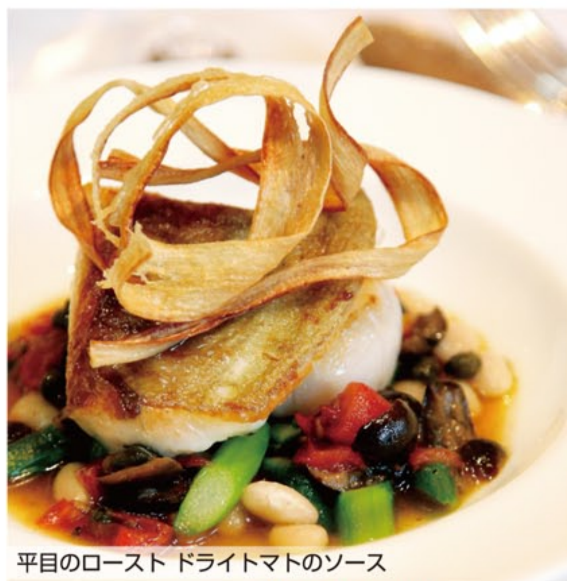
平目のロースト ドライマトのソース