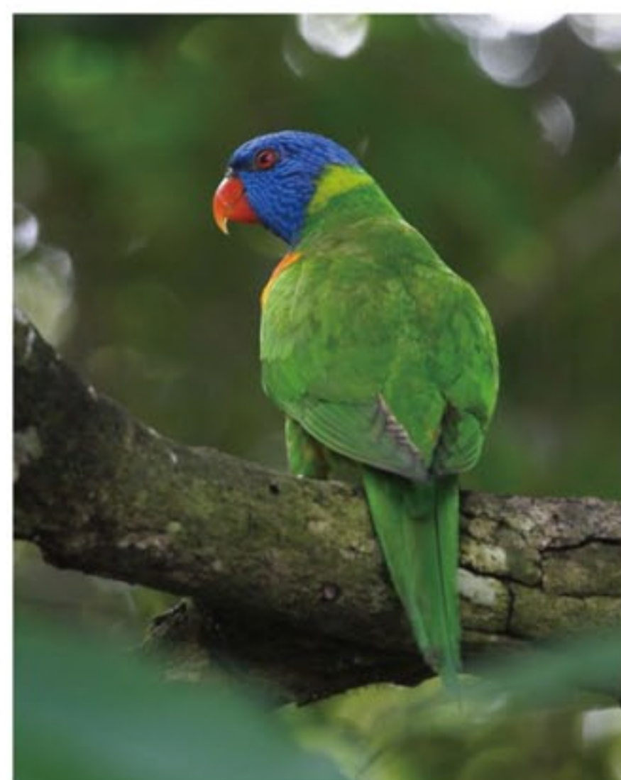
ゴシキセイガイインコ

オーストラリアにはオウムやインコの仲間も多く種類が生息しています。大型のキバタンは町の公園や郊外の川岸などでよく見られました。