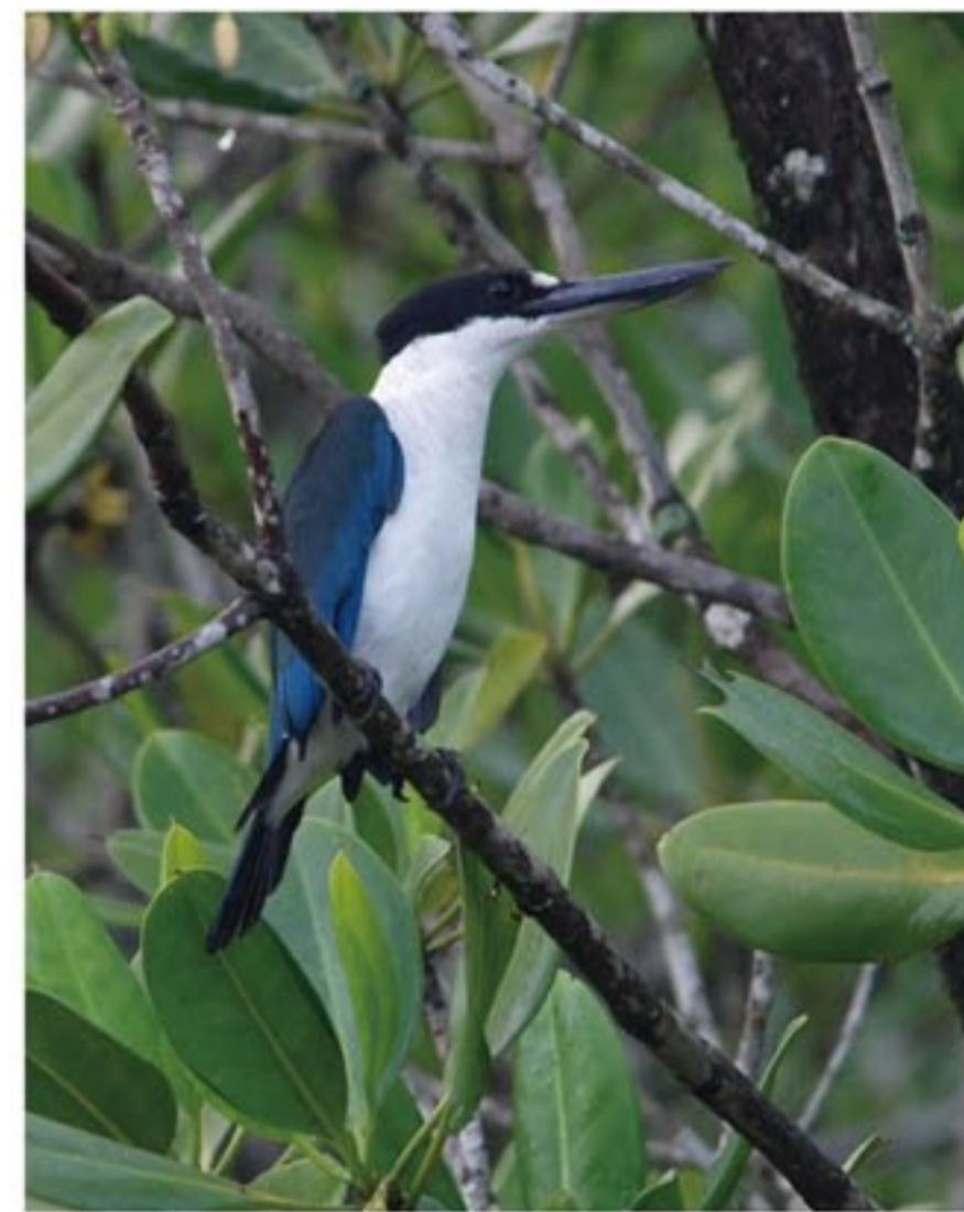
ナンヨウショウビン

一番会いたかったのはシラオラケットカワセミです。オーストラリアが夏になるとニューギニアから渡って来てオーストラリアの熱帯雨林で子育てをします。