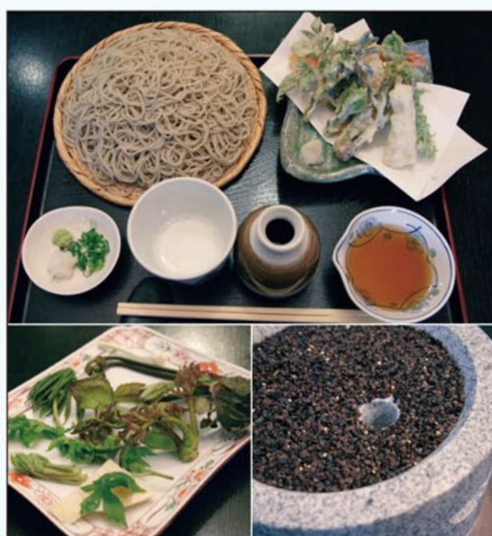
石臼挽き手打ちそば