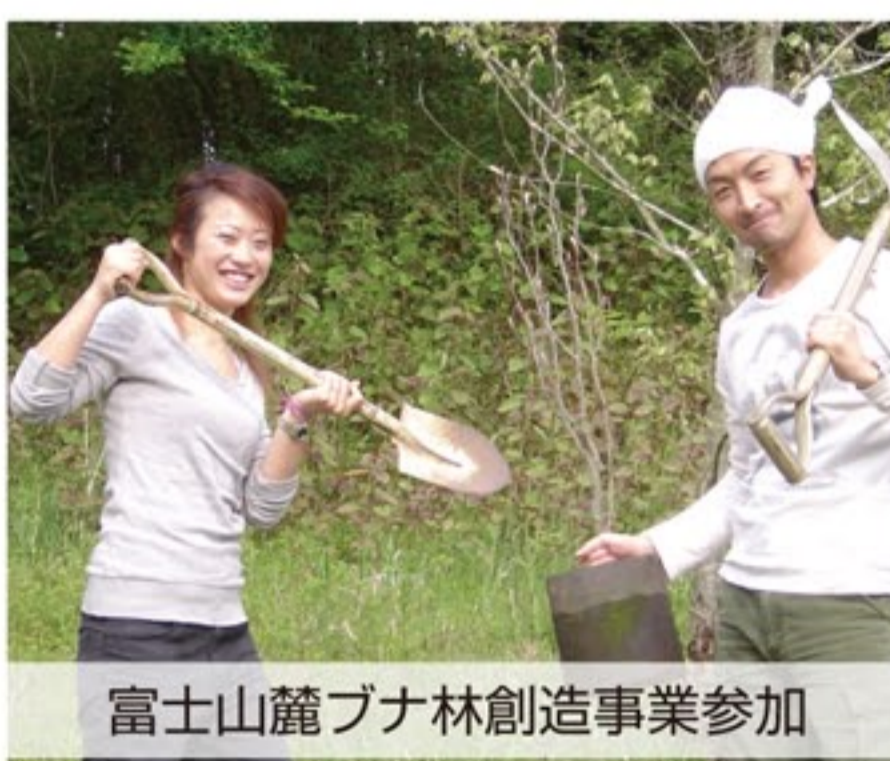
富士山麓ブナ林創造事業参加