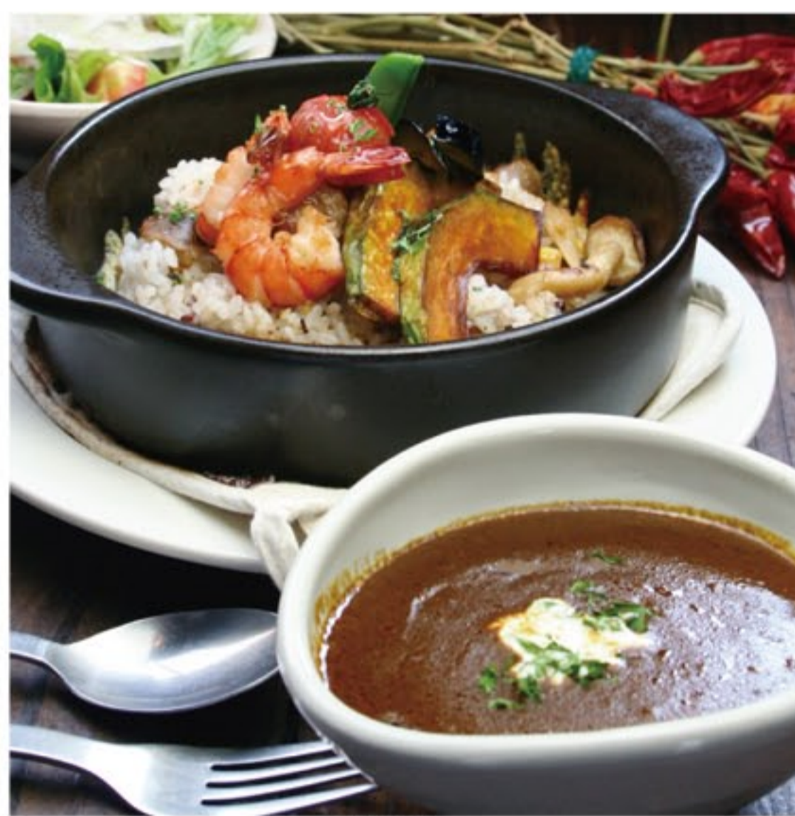
KICHI TO NARU 居酒屋 野菜・肉魚料理