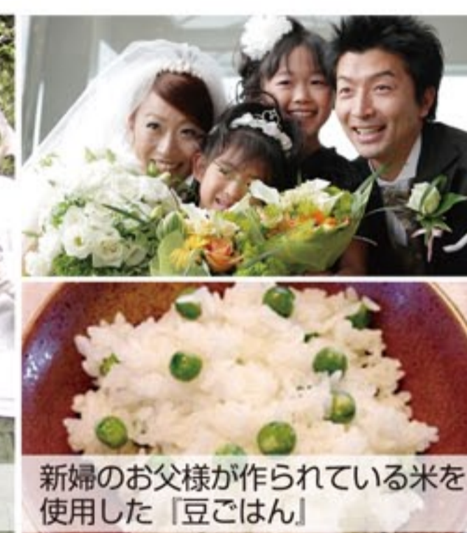
新婦のお父様が作られている米を使用した「豆ごはん」