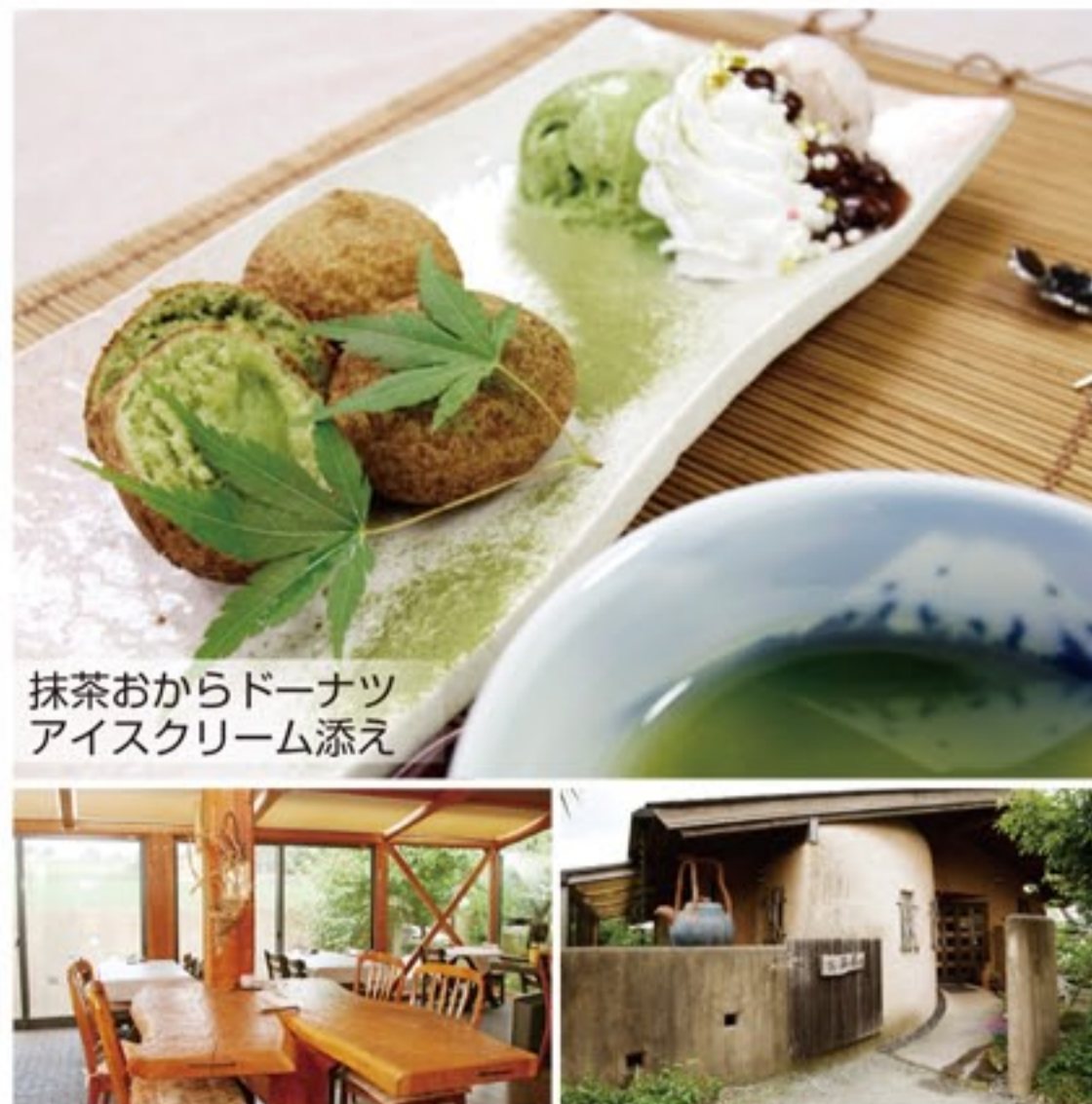
抹茶おからドーナツ アイスクリーム添え