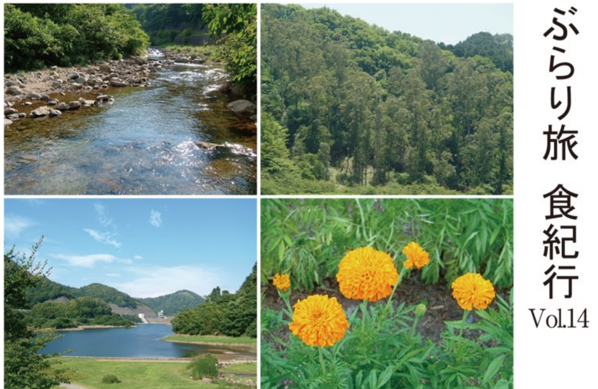
ぶらり旅 食紀行 Vol.14