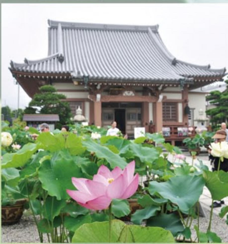
昨年の蓮まつりイベントの様子