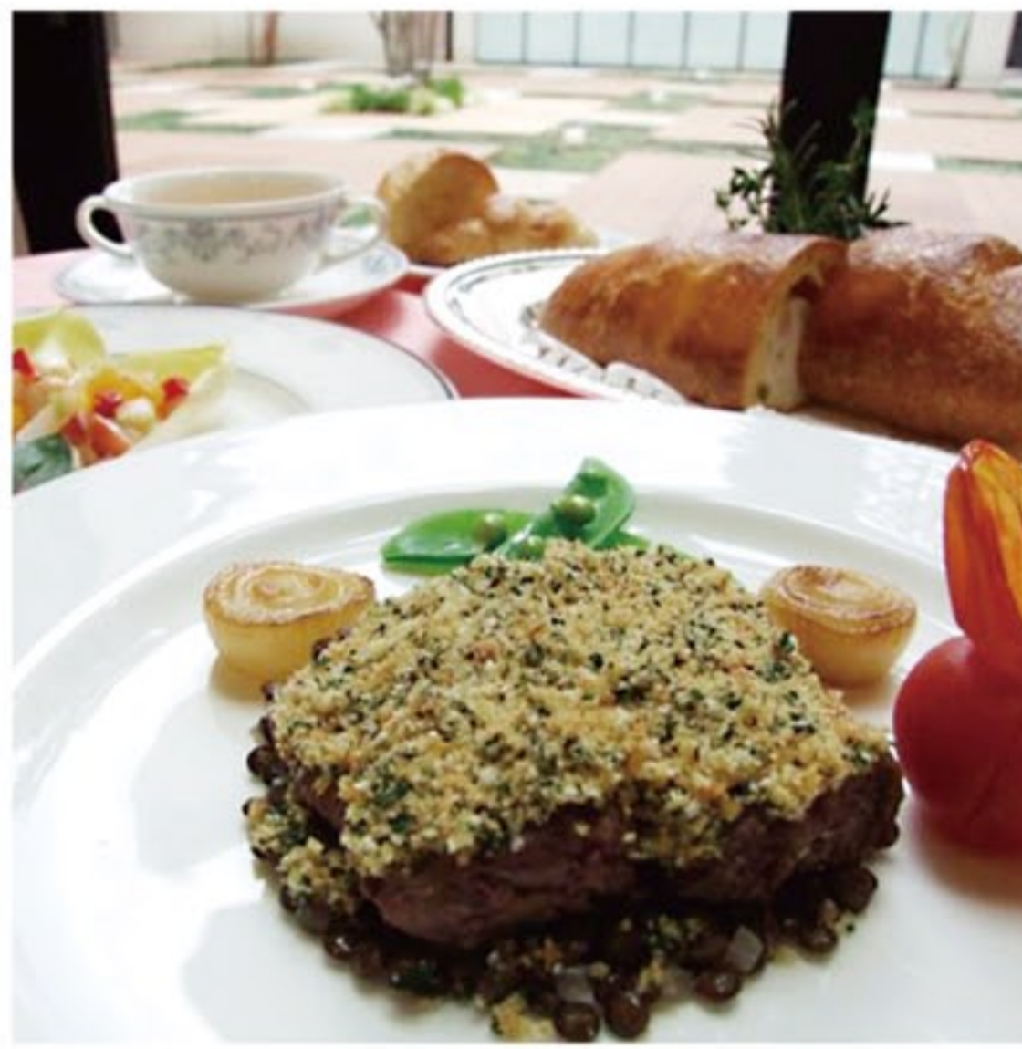
Hotel Grand Fuji ホテルグランド富士 レストラン グラス GRASSE