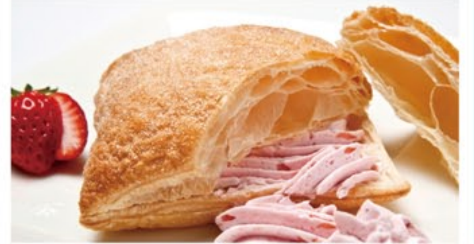
天使のミルフィーユ