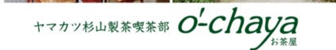
ヤマカツ杉山製茶喫茶部 o'chaya お茶屋