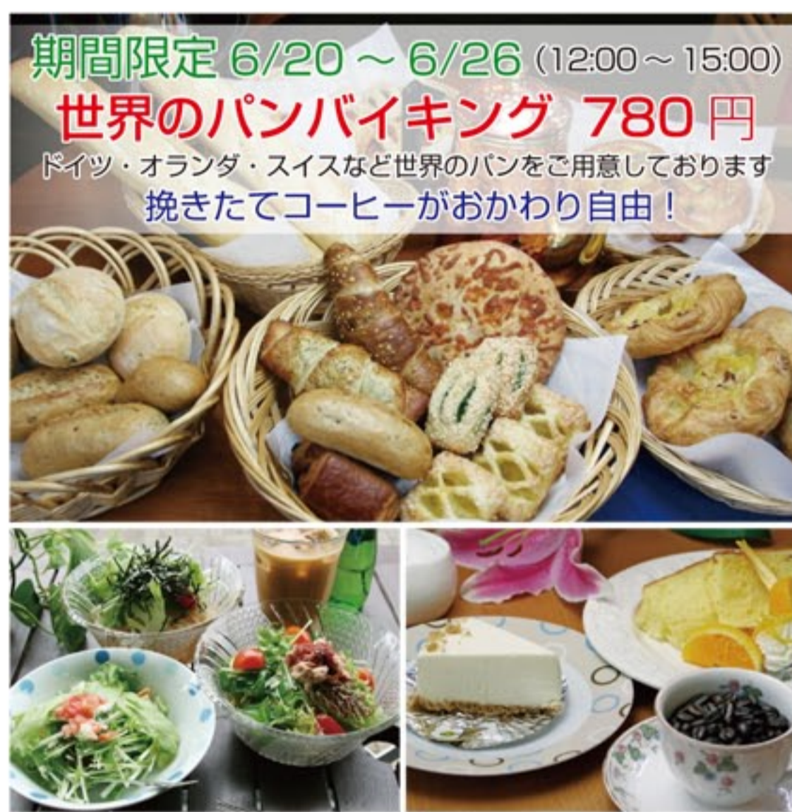
アラビカコーヒー ARABICA COFFEE