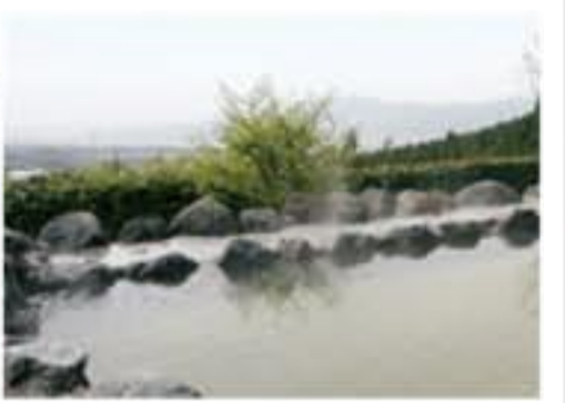
露天のヒノキ風呂からは富士山麓の町並みや駿河湾、伊豆半島まで一望できる。体を温める生薬露天風呂も人気。

住所：富士宮市山宮 3670-1 電話：0544-58-8851 時間：10:00～19:00（閉館20:00） 休み：月曜日（祝日の場合は翌日） 料金：（1時間）大人400円、子供200円（3時間）大人700円、子供350円（1日）大人1,000円、子供500円 交通：国道139号線バイパス北山インターより国道469号線経由、山宮小学校脇を左折、直進後右折 URL：http://anmonoyu.com