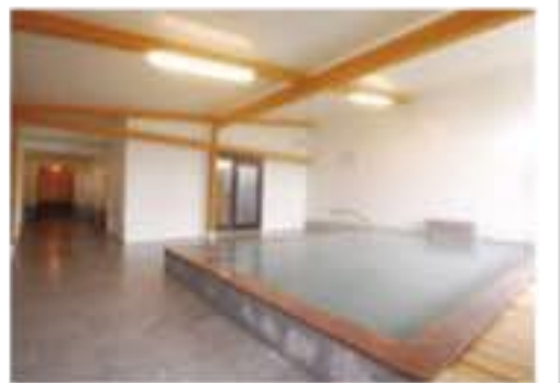
「バナジウム水」が新陳代謝を活性化。美容と健康、皮膚の老化予防にも効果的だ。四季折々の風を感じる高原の湯。

住所：富士宮市上井出 3470-1 電話：0544-54-2331 時間：10:00～22:00 休み：火曜日（祝日の場合は翌日） 料金：大人800円、子供500円（17時以降）大人500円、子供300円 交通：国道139号線バイパス上井出インターより県道71号線を北上すぐ URL：http://kazenoyu.net