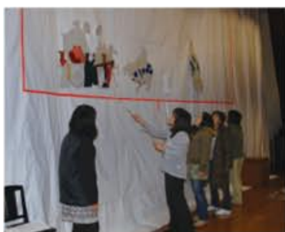
【右上】影絵上演時の舞台裏。影絵の静かなイメージとは異なり、常に十数人が動き回る忙しい現場。