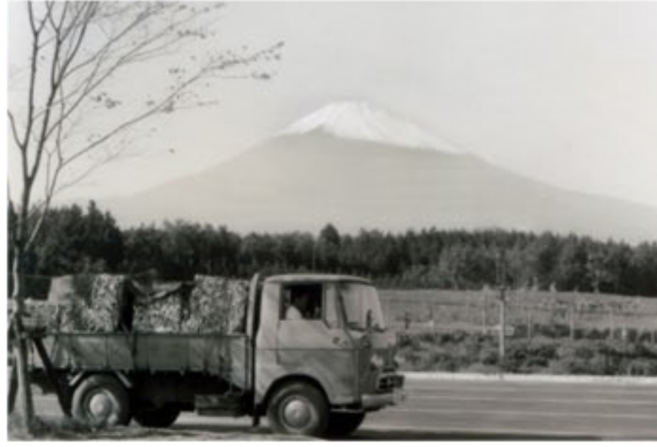
【上】中古で購入した初代のトラックは「エルフ」。扉の前方にドアノブがあるスタイルが年代を感じさせる。富士山をバックにした思い出深い記念写真。