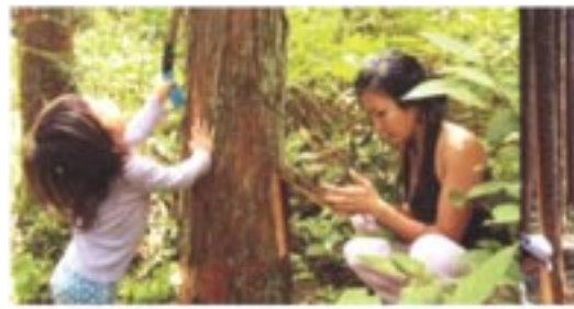
「きらめ樹」の様子。 みんな森づくりの主役です。