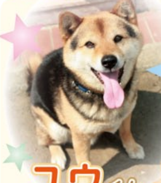
ユウくん 柴犬 (8歳・オス)

穏やかな性格で、犬も人も大好きなユウくんですが、夜はしっかり庭を見回ってパトロール。番犬としても優等生でおりこうなワンちゃんです。