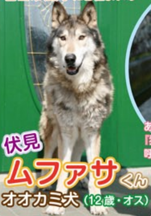
伏見 ムファサくん オオカミ犬 (12歳・オス)