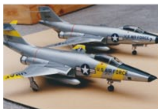
ソリッドモデルの戦闘機。とても木製とは思えないほど精巧でリアル。