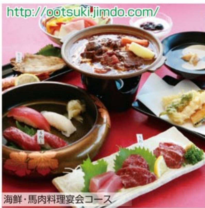
海鮮・馬肉料理宴会コース