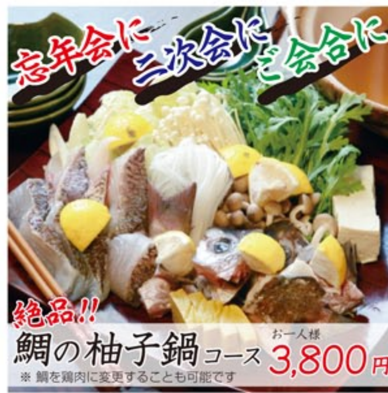
絶品!! 鯛の柚子鍋コース 3,800円