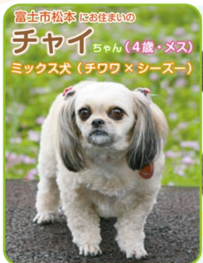
富士市松本にお住まいの チャイ ちゃん (4歳・メス) ミックス犬 (チワワ×シーズー)

富士動物医療センター http://www.famcjp.com 富士市今泉 2302-3 TEL: 0545-57-0001 Mail: info@famcjp.com