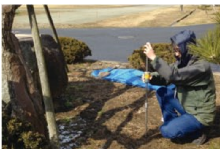
【左上】壊死した部分を取り除く治療の様子