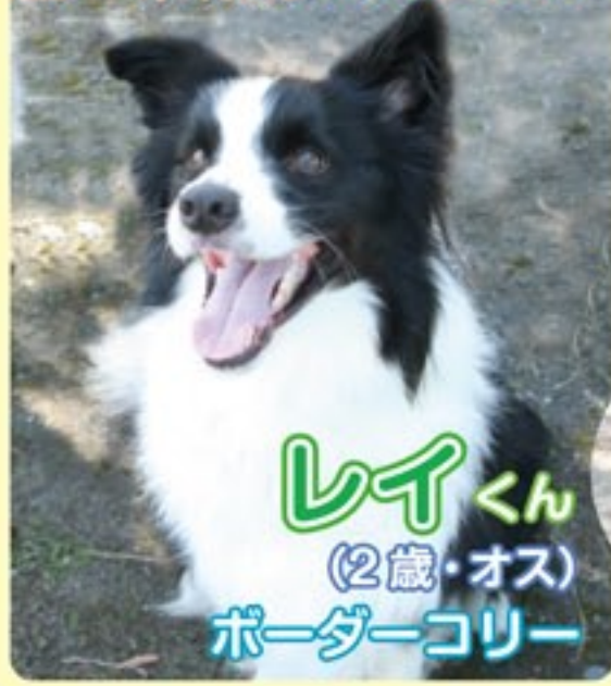
レイくん (2歳・オス) ボーダーコリー