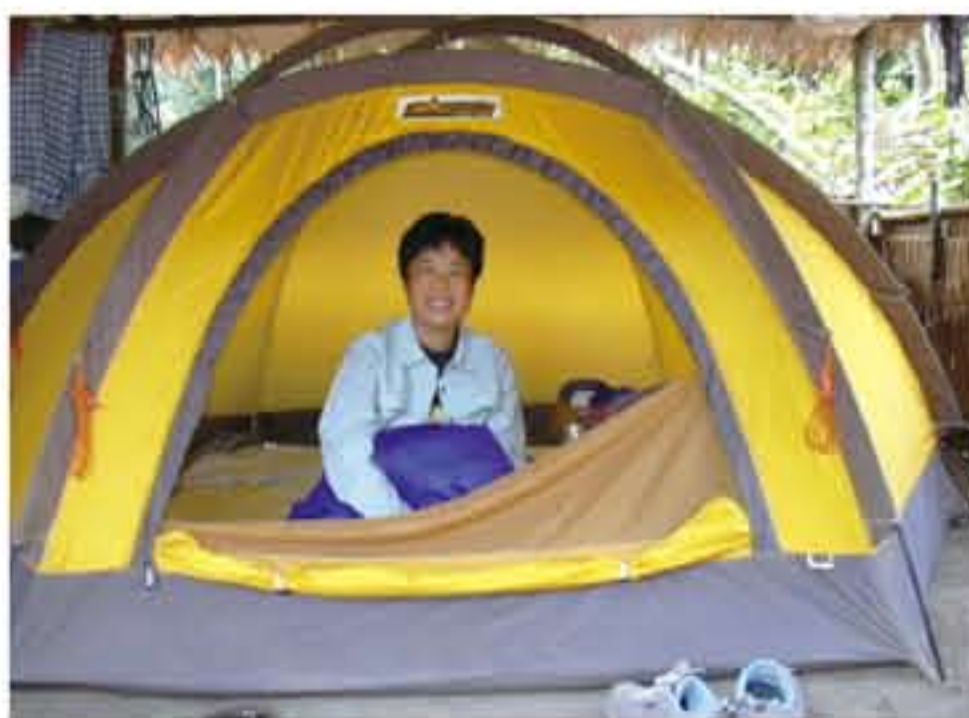
ガボンでのゴリラ生態調査ベースキャンプのテント。安藤さんは基本的にこのテントで生活していた。

「2003年から2015年まで、ガボンのムカラバ・ドゥドゥ国立公園でゴリラの生態調査を行う京都大学の研究グループにいました。私の任務は『人付け』と呼ばれるもので、餌を使わず長期間追うことで、人間への警戒心を取り除き、人間の前でも自然に行動できるように慣らすことでした。ラッキーなことに、私は初めて森を歩いた時に偶然ゴリラの群れと出会えたんですが、その後2ヵ月間ほどは全く見ることはできませんでした。ゴリラは私たちの気配を感じると逃げてしまうんです。ゴリラの人付けは毎日同じ作業を淡々と続けることが重要です。朝6時半にキャンプを出て、トラッカーと呼ばれる現地の案内人とともにゴリラの痕跡を探し、見つけたら後を辿る。夕方になったらキャンプに戻って、また翌日森に入って探す。そんなことの繰り返しです。その間に少しずつゴリラたちが警戒心を解いて、私たちの前に姿を見せるようになってきて、こちら名前を付けたりして親密になっていく過程がとても楽しかったですね。最初の5年間ほどはテント暮らしで、毎日休まず人付けをやっていました。私にとってはこれが苦にならないんです(笑)。ゴリラは絶滅危惧種として保護されるべき対象で、密猟や流行病、生息地の減少などが原因で頭数が減っているのが現状です。また4～5年に一度、1頭ずつしか子を生まないので、一度数が減ってしまうと回復するのがとても難しい動物なんです。調査には現地の村人との協力が必要不可欠ですが、村人たちが必ずしも私たち研究員と同じ視点で問題意識を持っているわけではありません。彼らにもゴリラの生態について知ってもらい、ともに生きる仲間として認知してもらうことが大切です。村人はあまり森に入らないので、ゴリラを見たことがない人も多いんですが、ゴリラの映像を見せると子どもたちは大喜びでした。また、基本的には自給自足の生活を送っている村人たちにも調査に参加してもらうことで、報酬という形での現金収入を少しでも得てほしい、生活を豊かにしてほしいという狙いもあります。これは私が現在携わっているエコツーリズムの考え方にも通じるのですが、ゴリラだけを見るのではなく、地元の人たちと研究者が協力し合える人間関係を作り、持続的にゴリラと共生できる環境を整えていくことが、私たちの目的です。」