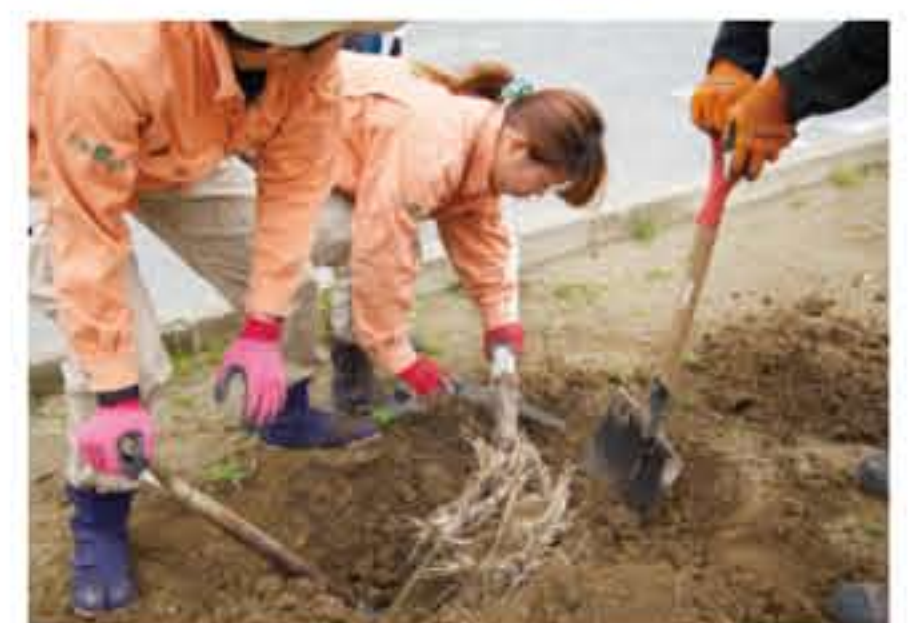
上) 植樹支援で植えられたまま管理が行き届かず、すでに半分まで枯れた状態のサクラ