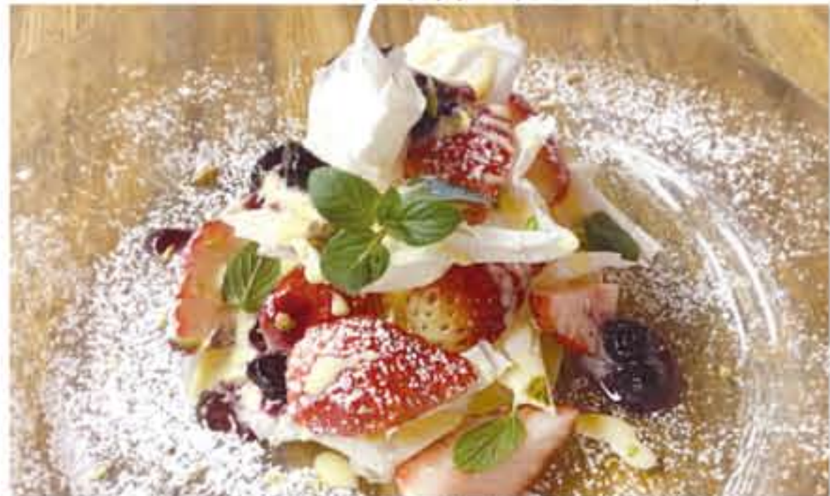
イチゴとブルーベリーのミルフィーユ

ランチ 1,800円・3,000円・4,200円・6,000円 ディナー 平日限定レディースディナー ..... 3,000円 ハーフコース ..... 4,500円 フルコース ..... 6,000円 シェフお任せフルコース ..... 8,000円 スペシャルフルコース ..... 10,000円