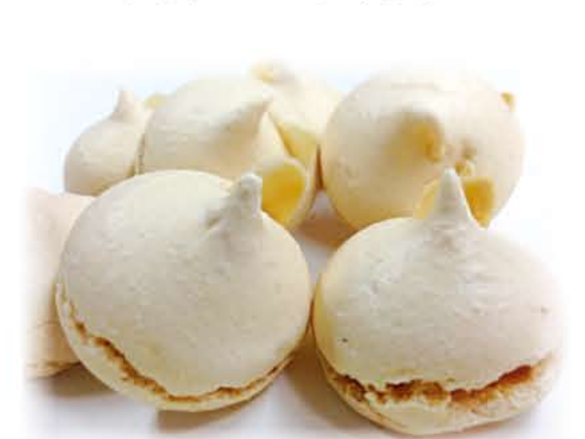
アーモンドメレンゲ