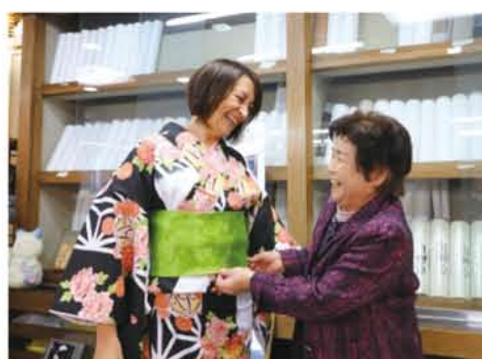
富士宮版エコツアー『まちなかツアー』の体験・見学会での一コマ。宮町商店街の呉服店で着付け体験を行う外国人観光客モデル。

や宝永山へのトレッキングなど各種ツアーを企画していますが、地域にある宝物を一つひとつつなげながら、より大きな楽しさを提供していきたいですね。」