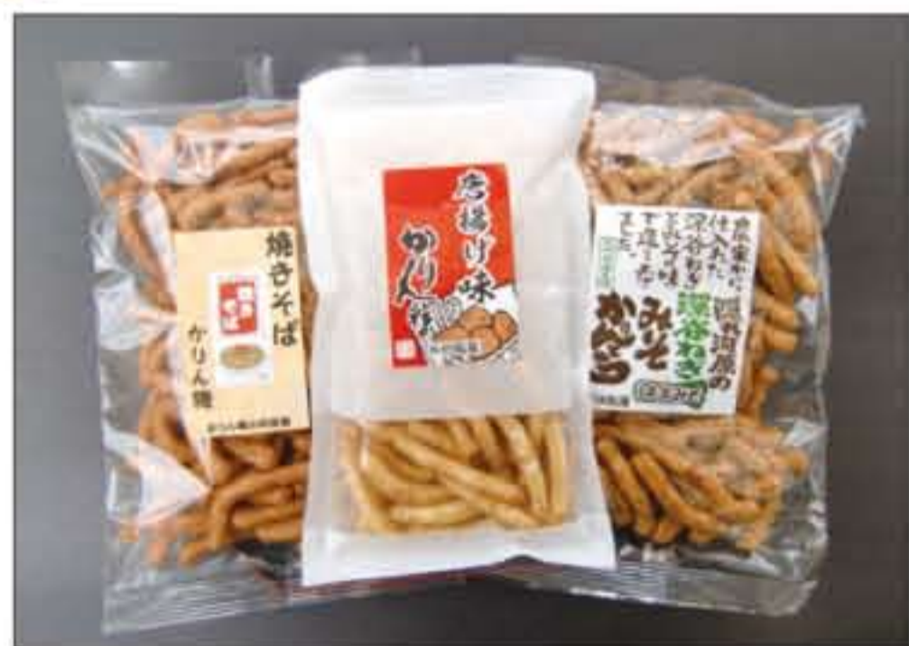
焼きそば・唐揚げ・ネギみそ味のおつまみセット