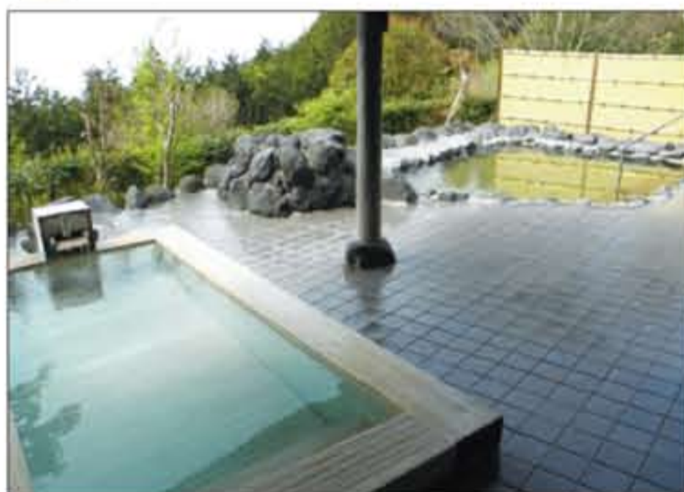
薬湯と森林浴でゆったりのおんぼり