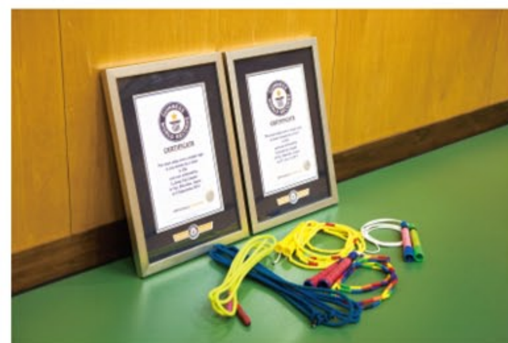
E-Jump Fujiが保有する2つのギネス世界記録認定証

した、やり抜いたということが大切なんだと思います。その本質はきっと、成功以上に人生を豊かにしてくれる『感動体験』なんですよ。」