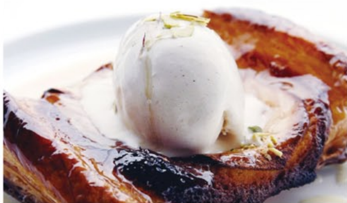
紅玉のバンドスバイスのグラス添え

ランチ 1,800円・3,000円・4,200円・6,000円 ディナー 平日限定レディースディナー ..... 3,000円 ハーフコース ..... 4,500円 フルコース ..... 6,000円 シェフお任せフルコース ..... 8,000円 スペシャルフルコース ..... 10,000円