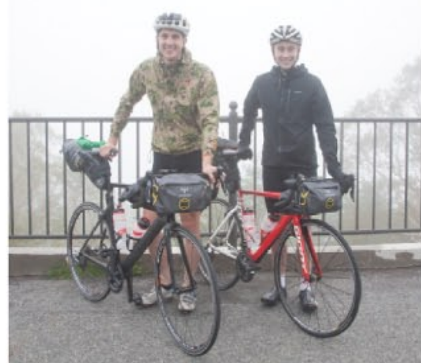
肌寒い濃霧の中でも気さくにインタビューに答えてくれた二人とその愛車。

天候や体調にも左右される自転車旅行で、故障すればその場で修理し、宿泊先もその日ごとに確保しているという二人。この記事の締切りの時点で岐阜県に在るとの連絡があった。広島まではまだまだ遠いが、引き続き安全を祈りたい。後日メールで送ってもらった写真には、日本の山々を駆け抜ける二人の姿がいくつも収められていたが、その中の一枚に淡々と添えられていた、ナチュラルらしい言葉が印象的だった。「時には晴れます、時には雨が降ることもあります(Sometimes it is sunny... Sometimes it rains.)」。なるほど、それで見えない富士山を前にしてもあんなにこやかだったのかと、納得できた。