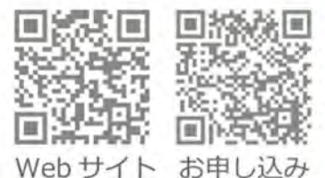
Web サイト お申し込み

富士宮市立中央図書館 0544-26-5062 Web サイト https://www.fujinomiyalib.jp/infoevent?7&pid=628