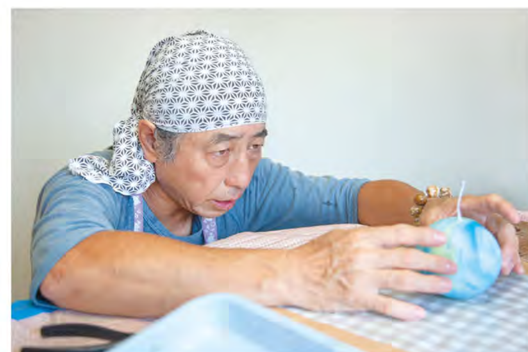
Title & Creative Direction/Daisuke Hoshino Text/Kazumi Kawashima

演出効果を発揮します。でも、非日常の特別な時だけでなく、キャンドルに親しんでもらい、良さを知ってもらって、習慣的に使う人が増えるように普及させたいという思いが原動力です。灯す機会があればどこへでも行きたいと思っています。フットワークを軽くしていると、出会いも広がります。これまでもたくさんの人との出会いに恵まれ、ご縁をいただいてやってきました。これからもご縁を大切に、つながりを濃くしていきたいです。」