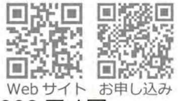
Web サイト お申し込み

ひらの鍼灸接骨院 0545-32-9868 お申し込み https://line.me/R/ti/p/%40nay6801k/