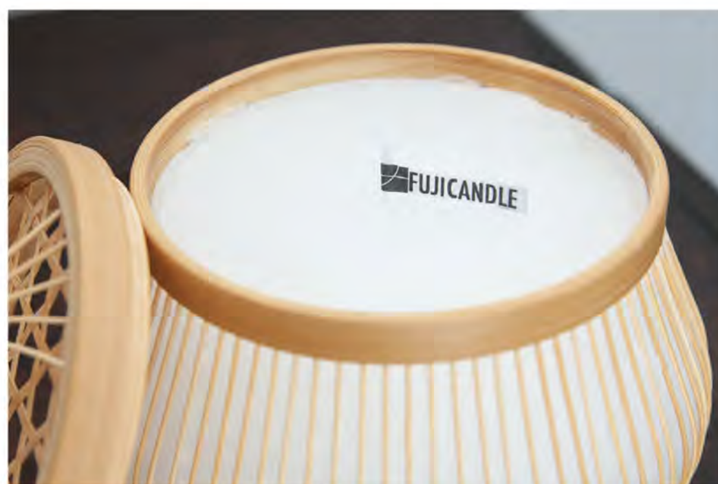
『駿河竹千筋細工』と融合した独創的な作品

「扱い方によっては、火はたしかに危険です。でも、だからといって避けてばかりはいられません。危険だからこそ扱い方を知ることが大切です。これまでいろいろな会場でキャンドルを灯してきましたが、小さな子どもがいても火傷などの事故が起きたことはありません。会場で火がついていると、子どもたちも自然にその周りに集まります。炎をじっと見て、そのうちに手をかざしたりするんですが、危なくないギリギリのところまで止まっています。僕も気にかけて見っていますが、『これ以上近寄ると熱い』と子