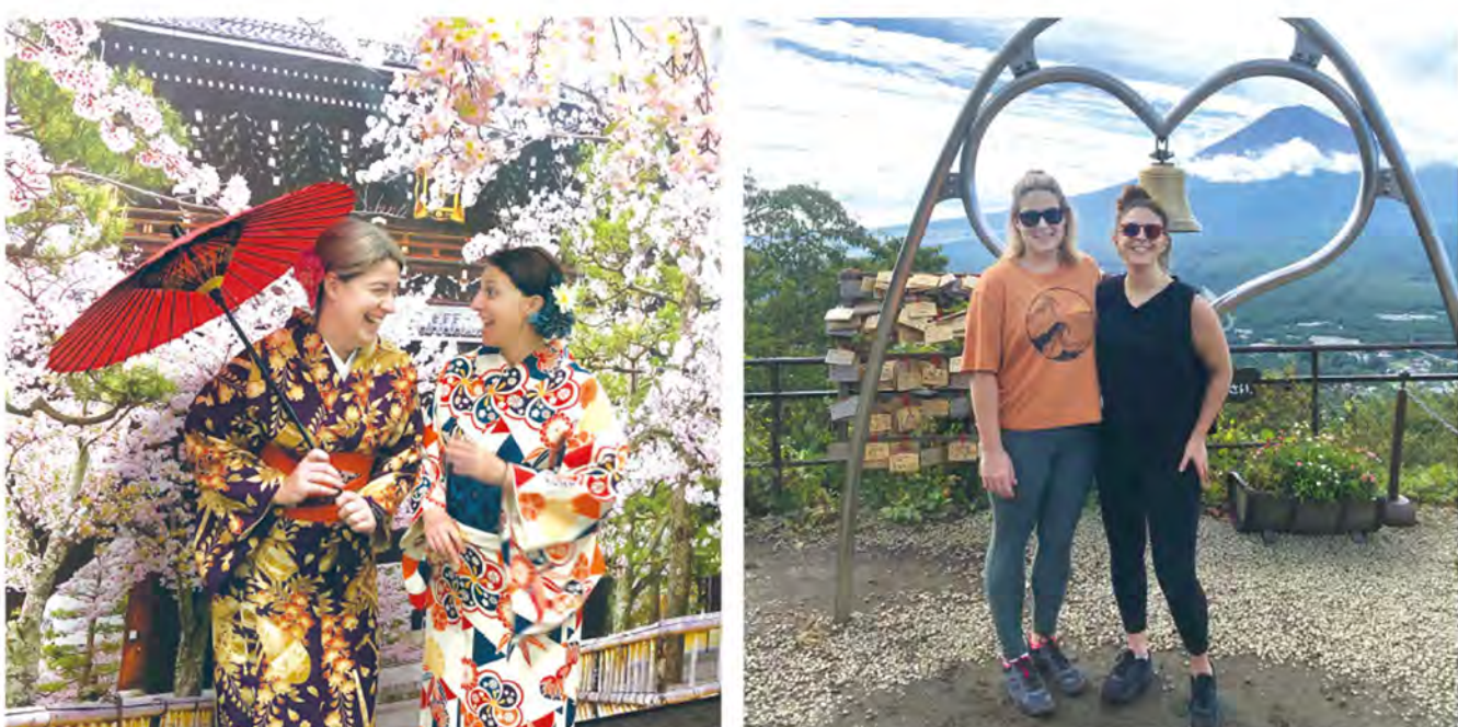
(左) 着物姿で茶会体験をした際の写真

外国人観光客の動向として、いわゆる爆買いに見られるような「モノ消費」から、体験そのものを楽しむ「コト消費」へのシフトが進むといわれているが、二人はまさに後者のタイプ。この他にも、東京都心の公道をゴーカートで走るアトラクション(いわゆる『リアル・マリオカート』)はオーストラリアでも知られていて、ぜひやってみたいとのこと。また、餃子作りの体験講座(餃子は日本食という認識らしい)にもすでに予約を入れているそうで、日本円で約8,800円というなかなかのお値段なのだが、「私たちが大切にしているのは、そこでしかできない体験をすることです」と、深い言葉が返ってきた。異文化に関心を持ち、実際に訪れ、地元の人々とも積極的に関わろうとしてくれる二人の気持ちが嬉しかった。そして同時に、「もしお店で8,800円分の餃子を注文したら、うんざりするほどお腹いっぱいになりますけどね、ははっ」などと小手先のギャグで笑いを取りにいった自分が猛烈に恥ずかしくなった。