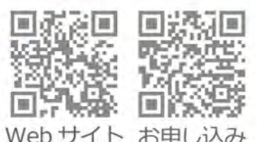
Web サイト お申し込み

Little Bridge(リトルブリッジ) 0545-67-2550 お申し込み little.bridge.chichester@gmail.com