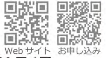
Web サイト お申し込み

ひらの鍼灸接骨院 0545-32-9868 お申し込み https://line.me/R/ti/p/%40nay6801k/