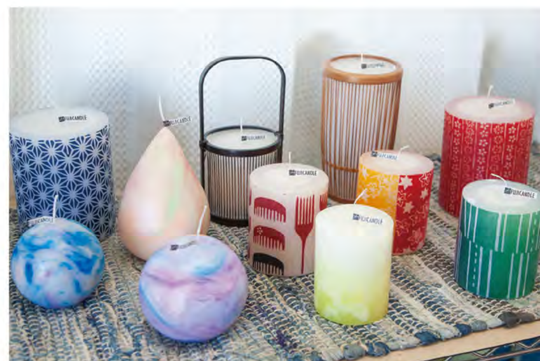
多彩なデザインが魅力のオリジナルキャンドル