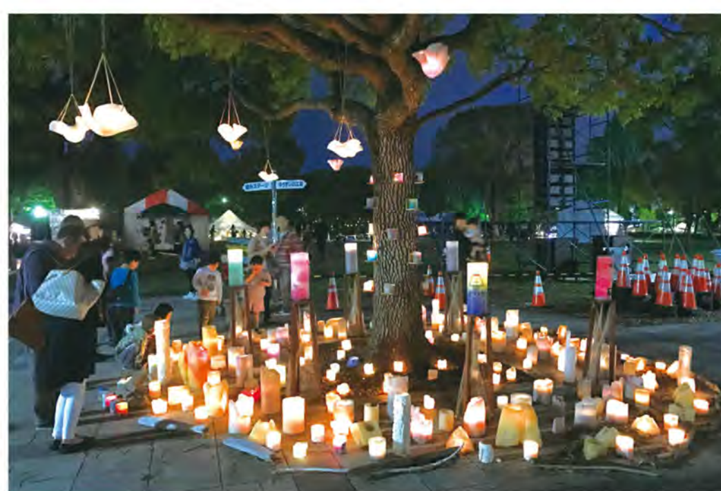
富士市中央公園で開催されたイベントでの展示風景