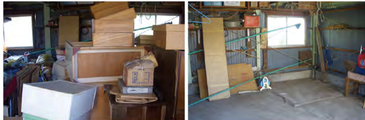
倉庫清掃作業前 作業後

ご家庭のお掃除から店舗や事務所のフロア清掃まで、プロの技術とアイテムで快適な新年を迎えませんか？