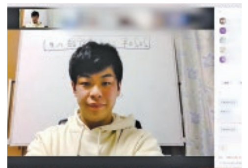
オンライン会議ツール・ZOOMのユーザー画面