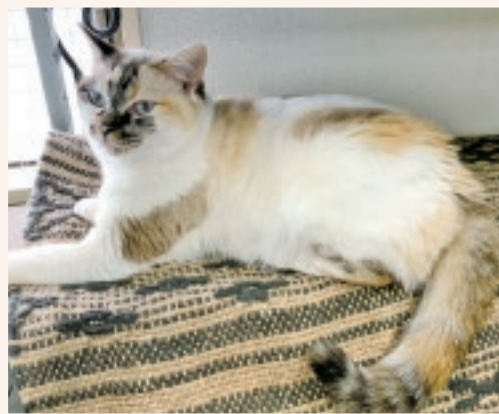
🐾 ピンクちゃん (メス:3歳)

優しい毛色が自慢のパステル三毛です。人が大好きで、すぐスリスリしたくなります。チュールが大好きな甘えっ子です。(避妊済)