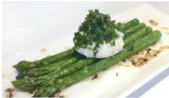
グリーンアスパラ ポーチドエッグ添え

ランチ 1,800円(平日限定)・3,000円・4,200円・6,000円 ディナー ハーフコース 4,500円 フルコース 6,000円 シェフお任せフルコース 8,000円 スペシャルフルコース 10,000円