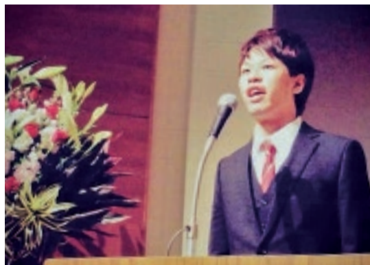
富士市成人式の実行委員長として壇上に立つ

髪を赤く染めてみたりして、肝心の授業では教室の一番後ろでカップラーメンを食べてるみたいな感じで、なりたいたい自分とはかけ離れた存在でした。大きな転機になったのは、大学の先輩が『名古屋わかもの会議』という市民活動を立ち上げて、東京と名古屋を往復しながら頑張っていると知った時です。東京で学生生活をしながら、自分の地元を盛り上げる活動なんて可能なのかと、衝撃を受けました。僕は心に響いたらすぐに動くタイプなので、まだ面識のなかったその先輩に連絡を取って、話を聞くために会いに行きました。熱い思いを語る先輩の姿がかっこ良くて、憧れて、富士でも若者の力で何か貢献できることはないだろうかと考えるようになったんです。その思いが成人式の実行委員長や『富士山わかもの会議』の発足、そして『#おうち先生』の活動へとつながっていきました。」