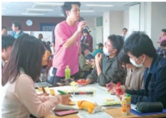
『富士山わかもの会議』での活発なワークショップ

ゲームを使いながら学ぶワークショップなど、地域社会の課題や未来について考える場づくりに取り組みました。最初のうちはイベントを開催しても、緊張してうまく思いを伝えられなかったり、準備不足で会場の一体感を作り上げることができなかったり、失敗もたくさん経験しました。ただ、僕はたいてい何でも最初は失敗するんです(笑)。でもそこから学んで、成長すればいいのかなとも思っています。現在は『富士山わかもの会議』の代表を後輩に引き継ぎましたが、富士の若者が社会に対して積極的に行動する機運がさらに高まると嬉しいです。」