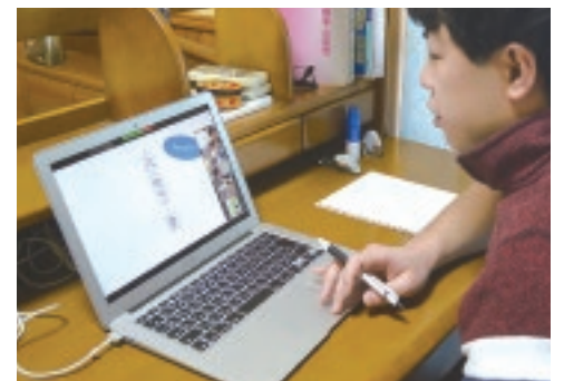
自作の資料を使いながら子どもたちに語りかける